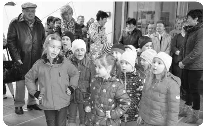
K razstavi Sončnic so tudi letos s svojimi izdelki pristopili malčki iz vrtca Rožle.