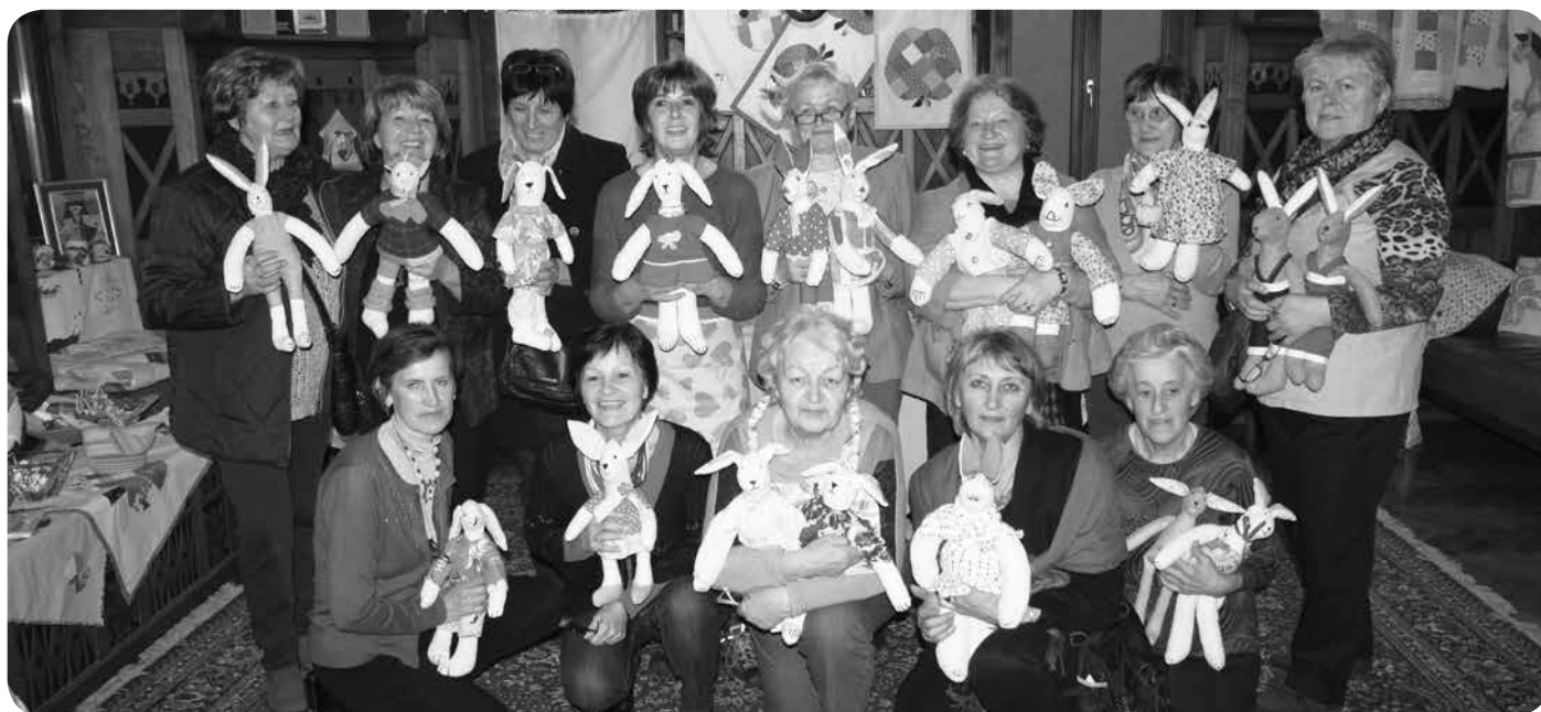
Ekipo babic, ki je ustvarila 17 zajčkov.