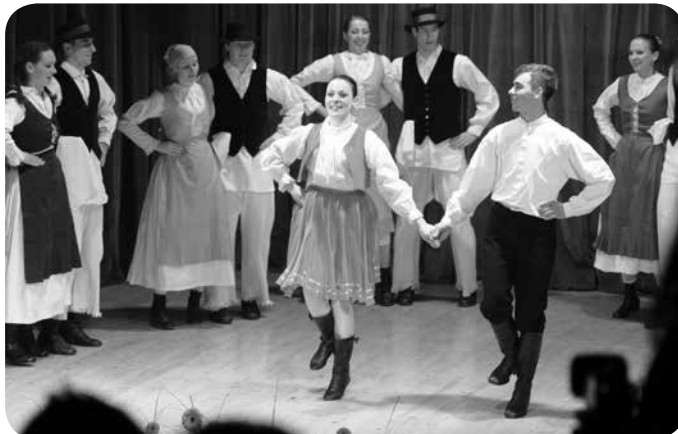
Prekmurski pelesi – čardaš.

V goste smo povabili tudi dve domači skupini: Ljudske pevce Zarja, ki so zapeli dve pesmi in Čušperske godce, ki so zaigrali tri poskočne viže.