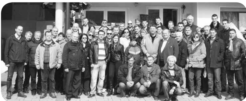
15. 3. 2015 - obisk srbskih čebelarjev iz Požarevca