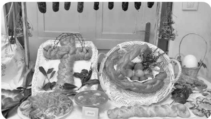
Utrinek iz razstave Društva podeželskih žena SONČNICA.

gim povedala, da je znani etnograf Štefan Šubic že pred 150 leti izjavil, da pravzaprav narod mora poznati svoje običaje, da bolje razume tudi svet okrog sebe. In ravno s pomočjo takih razstav razumemo sebe in naš prostor, v katerem živimo. Sedaj, v tem globalnem času, pa je to še bolj pomembno. Vračamo se nazaj k svojim koreninam ter ustvarjamo svojo identiteto in podobo tega prostora.