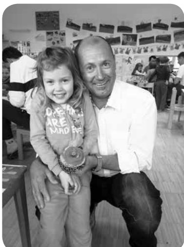
Ponosna vnukinja z dedkom z unikatno broško za mamico.

Delavnice se je udeležilo kar nekaj očkov z otroki, pa tudi en dedek s svojo vnukinjo. Igralnice so napolnili s pozitivno energijo in veseljem do dejavnosti, saj so izdelovali broške iz blaga. Pokazali so veliko ustvarjalnosti, samoiniciativnosti in bolj se je delavnica bližala h koncu, bolj zavzeto smo vsi ustvarjali.