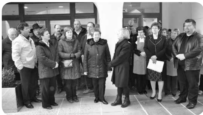
Na odprtju razstave Društva podeželskih žena SONČNICA.

V odprtje razstave so nas popeljali Ljudski pevci Zarja iz Račne, zapeli in zaplesali pa so tudi naši najmlajši iz vrtca Rožle. Prisluhnili smo pesmim o ptičkih, saj smo še nedavno praznovali gregorjevo, pa pesmim o naših materah, prav ta dan so namreč praznovale tudi vse matere, in pa seveda velikonočno obarvanim pesmim.