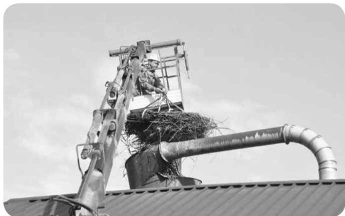
Gnezdo je bilo nameščeno na gospodarskem posloplju.