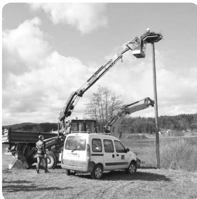
Gnezdo na novem gnezditvenem podstavku.