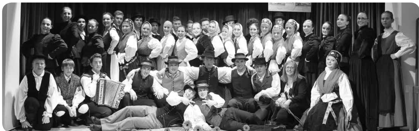
Slika vseh nastopajočih.