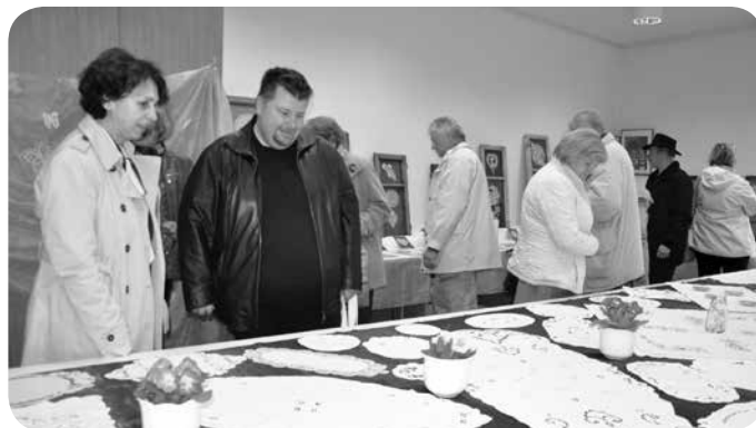
Utrinek iz razstave klekljaric in vezilj, ki nosijo ime Ažur.