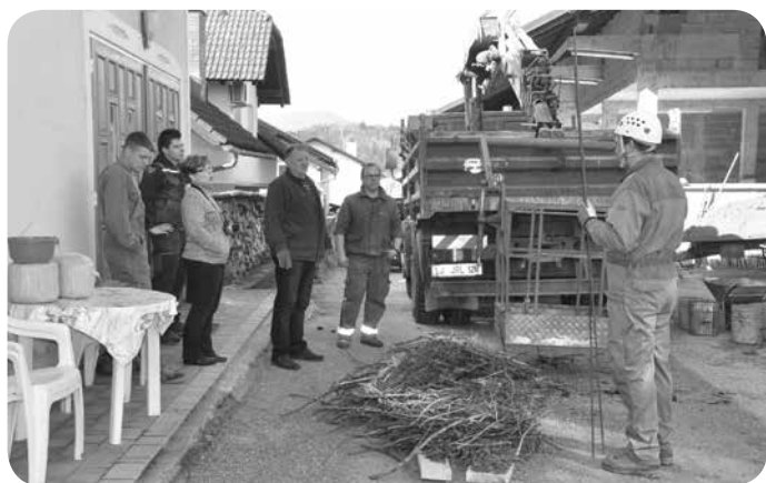
Gnezdo smo iz gospodarskega posloplja prenesli na kovinski podstavek.

Kaj kmalu smo postavili pokonci podrti drog ob železniški progi v Grosupljem, lani pa je štorkele v zaselku Benat v Ponovi vasi pričakal nov gnezditveni podstavek. To pomlad bo lepo darilo, nov gnezditveni podstavek na travniku med Ponovo vasjo in Malo vasjo, blizu vrtca Jurček, po vrnitvi iz Afrike pričakalo še en par štorkeelj.