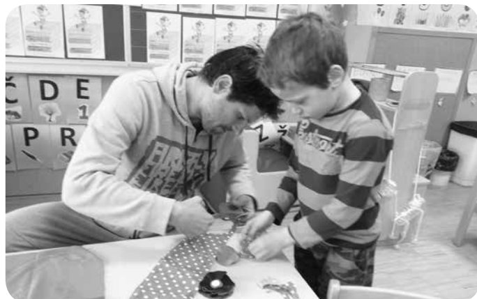
Izrezala bova kroge iz blaga ...

V vrtcu Zvonček v Žalni smo v ponedeljek, 23. marca 2015, izpeljali ustvarjalno delavnico, ki pa je bila malo drugačna kot ponavadi, saj so se delavnic lahko udeležili le otroci, očki, dedki, strici ... pripravljali smo presenečenje za mamice ob materinskem dnevu.