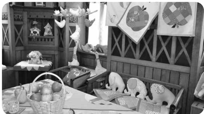
Utrinek iz razstave »Iz dobrih rok v srca otrok« rokodelske skupine Društva upokojencev Grosuplje.