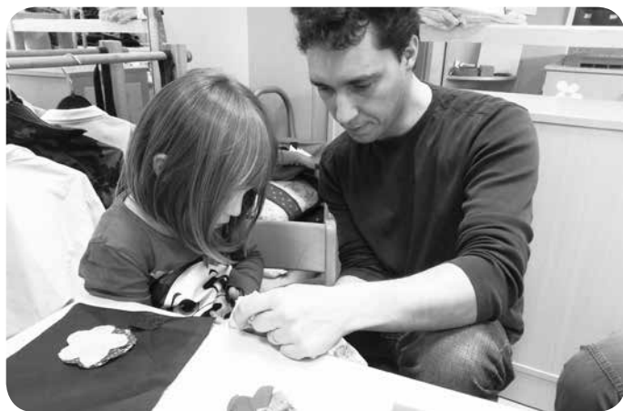
...zašila bova broško za mamico.

V vrtcu Zvonček v Žalni smo v ponedeljek, 23. marca 2015, izpeljali ustvarjalno delavnico, ki pa je bila malo drugačna kot ponavadi, saj so se delavnic lahko udeležili le otroci, očki, dedki, strici ... pripravljali smo presenečenje za mamice ob materinskem dnevu.