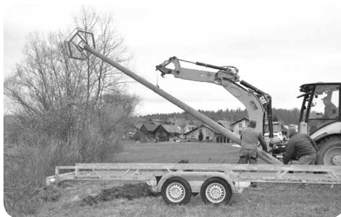
Na travniku med Ponovo in Malo vasjo smo postavili leseni drog z gnezditvenim postavkom.

Kovinski podstavek je doniralo podjetje Comita, beton