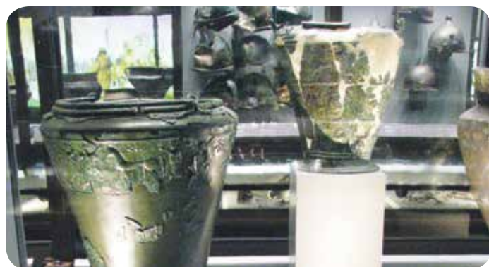
Situla z Magdalenske gore, v vitrini v ozadju so vidne čelade s slovenskih halštatskih najdišč.