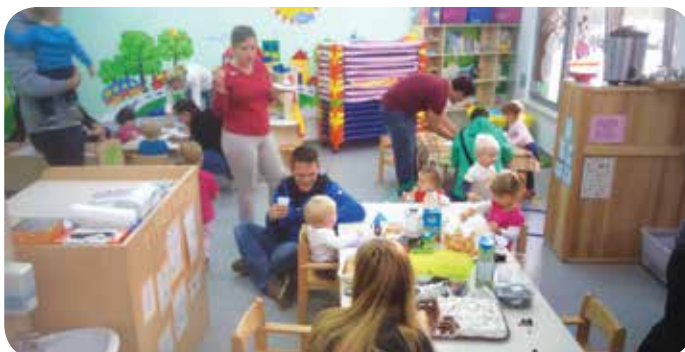
Likovno ustvarjanje in sproščeno druženje ob sladkih dobrotah.