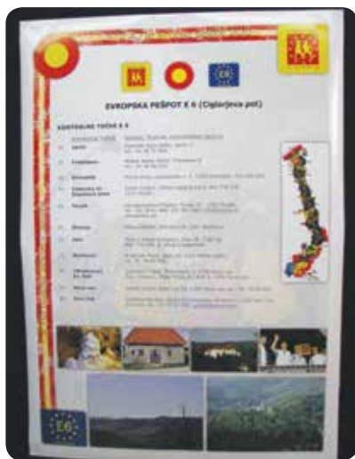
Plakat E6 z označenimi kontrolnimi točkami po naši občini

Evropski mreži 12 pešpoti, ki se raztezajo v skupni dolžini 1000 km po vsej Evropi, se v Sloveniji pridružujeta E6 in E7. Pohodniki, domači in tuji, ob poti spoznavajo lepoto naše domovine, kulturno in naravno dediščino in prispevajo k sožitju, sporazumevanju in miru v svetu. E6 vodi od Baltika do Jadrana. Naš del poti od Drave do morja je postavil gozdarski inženir Milan Ciglar leta 1975, zato se po njem tudi imenuje. Komisija za popotništvo, ki je delovala pod okriljem Planinske zveze Slovenije in Zveze gozdarskih društev Slovenije, je poti trasirala, označila in vsa leta tudi primerno vzdrževala. Postavili so kontrolne točke, kjer so