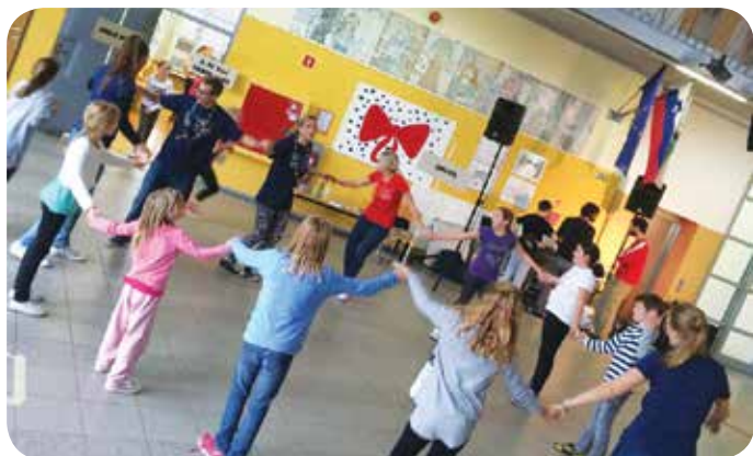
Otroci se igrajo.