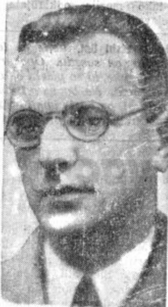
Artur Seyss-Inquart, novi avstrijski zunanji minister

Ob tej priliki je bilo tudi pojasnjeno, pod kakimi pogoji je dobila Zadruga zveza 63 milijonov dinarjev. Zadruga zveza namreč jamči za prejete milijone s posebnim fondom, ki ga je osnovala Zadruga gospodarska banka iz vsote od 40% odpisanih vlog, ki se niso obrestovale.