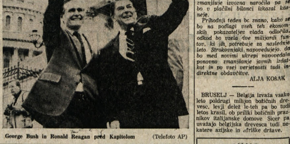
George Bush in Ronald Reagan pred Kapitolom

Ta epizoda, ki je sicer dala mo-ravno zmago laburistom, pa je po drugi strani izvala trditve, da predstavljajo usodno spominjenje zna-menje o tem, kako se bo opozici-ja obnašala pod vodstvom Michae-la Foota. Na splošno je ta akcija