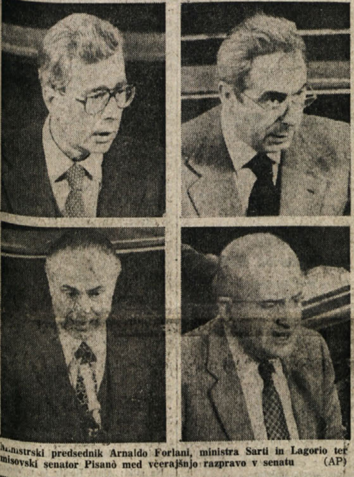
Ministrski predsednik Arnaldo Forlani, ministri Sarti in Lagoria ter misovski senator Pisano med včerajšnjo razpravo v senatu

zadovoljivo rešeno, kar pa ne sme ovirati razširjanja sicer dobrih odnosov. Samo tako bo mogoče dosti lažje in hitreje rešiti tudi odprta vprašanja. Komisija se je zavzela tudi za nadaljevanje in pospeševanje stikov občin in drugih dejavnikov ob meji z ustreznimi v sosednjih deželah, hkrati pa tudi za hitrejši pretok medsebojnega informiranja teh lokalnih in republiških teles o dogovorih na mednarodni ravni. Komisija je potrdila pristop in konvenciji o priznanju visokosolskega študijskega dijela v državah, ki pripadajo evropski regiji, kakršno je pripravil UNESCO. Te konvencije doslej niso sprejele samo Italija, Avstrija, Švica in Kanada. Konvencija je sicer samo priporočilne narave, saj pristop k njej sam po sebi ne zagotavlja priznanja diplom, temveč v sedanji fazi služi bolj kot vzor, kako naj bi države to občutljivo vprašanje reševale med seboj. Kot je znano sta Jugoslavija in Italija na tem področju doslej sklenile le en sporazum (to je občutno manj kot jih je Jugoslavija sklenila z drugimi sosedi) in sicer, ko sta leta 1971 vzajemno priznali spričevala za vpis na visokosolske ustanove.