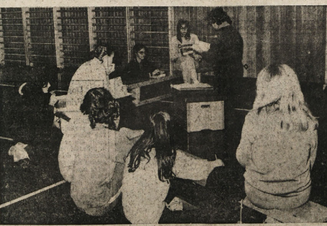
Konec prejšnjega tedna se je v Gorici zaključil prvi tečaj za vaditeljice predšolske telovadbe, ki ga je v novi telovadnici v UL Bress organizirala Komisija za STV, gimnastično in moderno ritmično gimnastiko pri ZSSD.