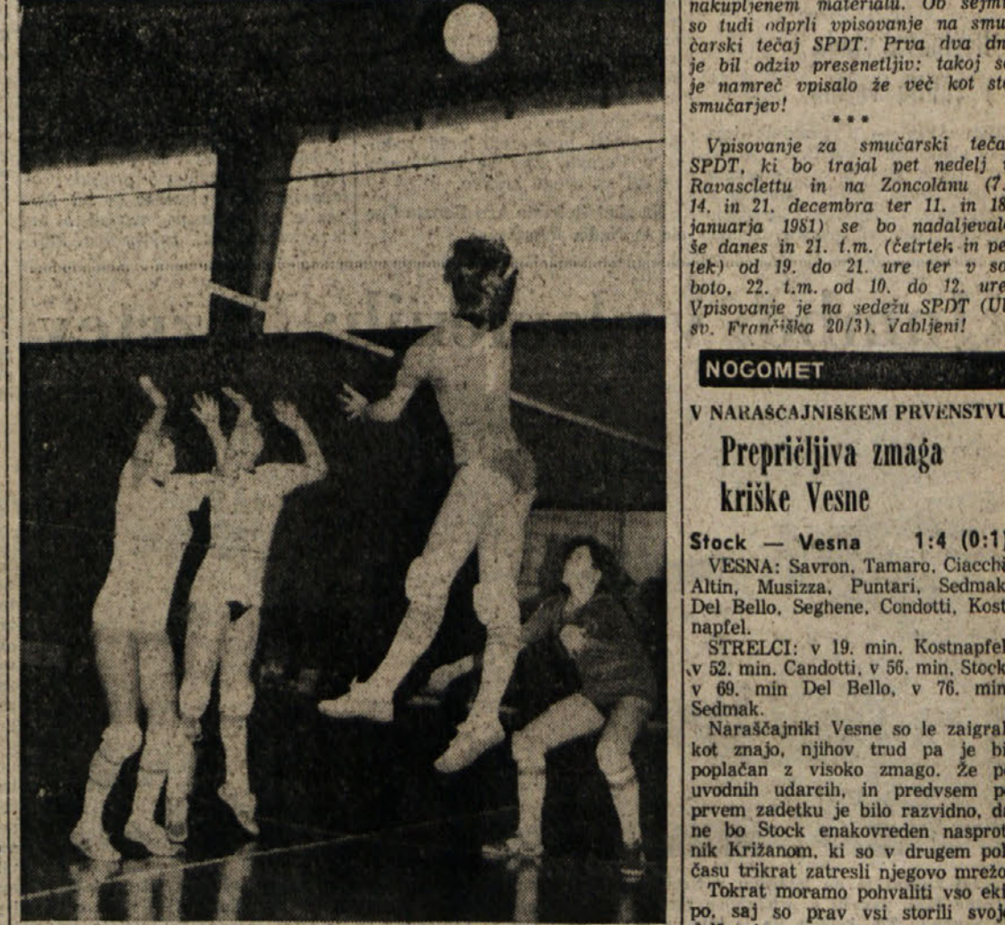
Posnetek s slovenskega odbojarskega deraja mladink Sokol - Bor