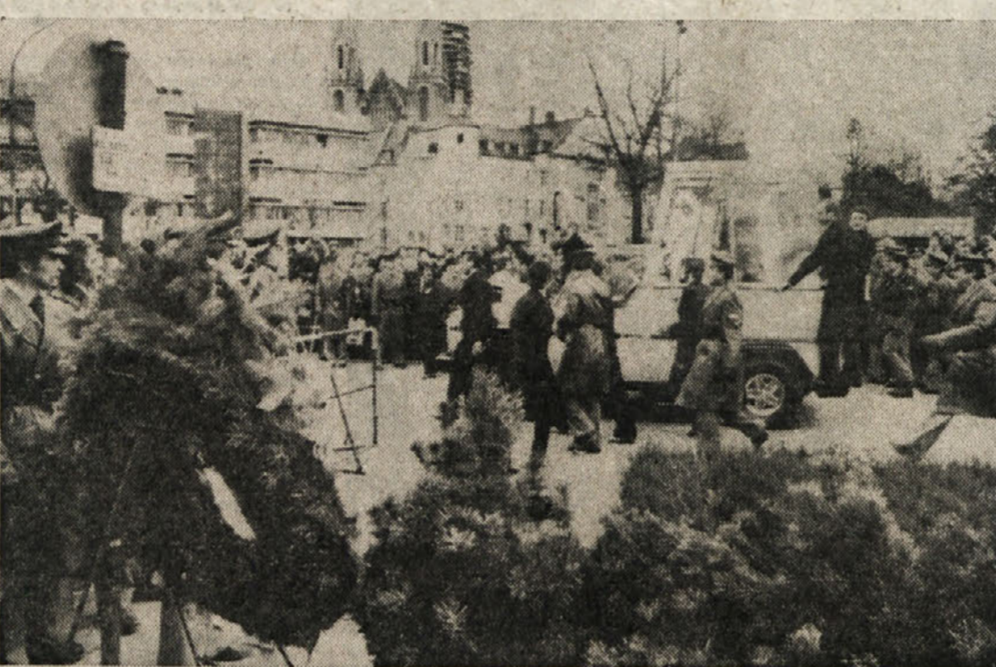
Papež se je peljal tudi mimo vhoda na Oktoberfest, kjer je v septembru v bombnem atentatu izgubilo življenje 13 oseb, več kot 100 pa jih je bilo ranjenih.