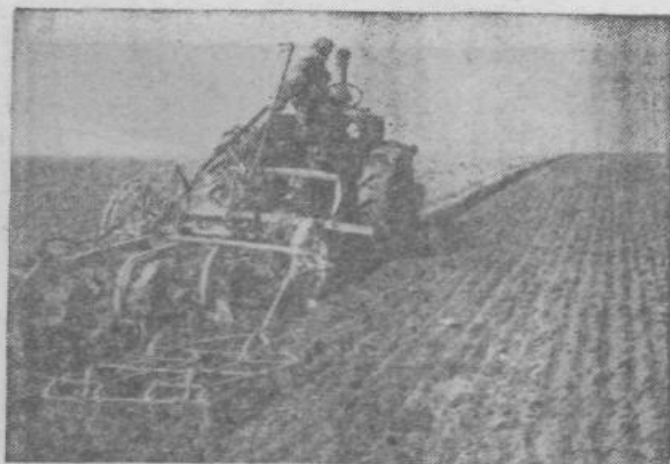
Jesenska setev se je pozno začela. Do 9. novembra je bilo sašeno v Sloveniji 95%, v ožji Srbiji 80%, v Vojvodini 78%, na Hrvaškem 65%, v Bosni in Hercegovini 45% in v Makedoniji 45%.