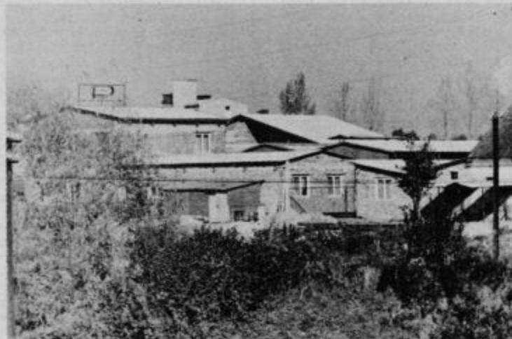
Primat TOZD IV v Ormožu se je že precej razširila.