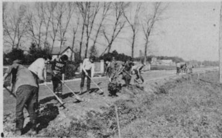
Nedeljsko delo pri urejanju bankin in jarkov v Laporju.

Akcija urejanja bankin in jarkov bo potekala še nekaj časa. Za asfaltiranje ceste so porabili 94 milijonov SD od katerih 50 kreditira Zavarovalnica Maribor prek komunalnega sklada SO Slov. Bistrica. Preostala sredstva pa so zagotovili krajanje z prispevki in udarniškim delom. VH