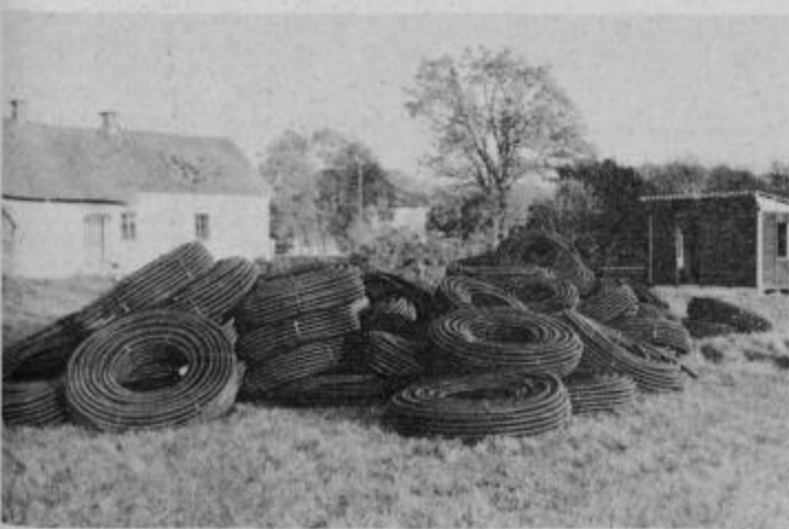
Drenažne cevi čakajo na odločitev kmetov.