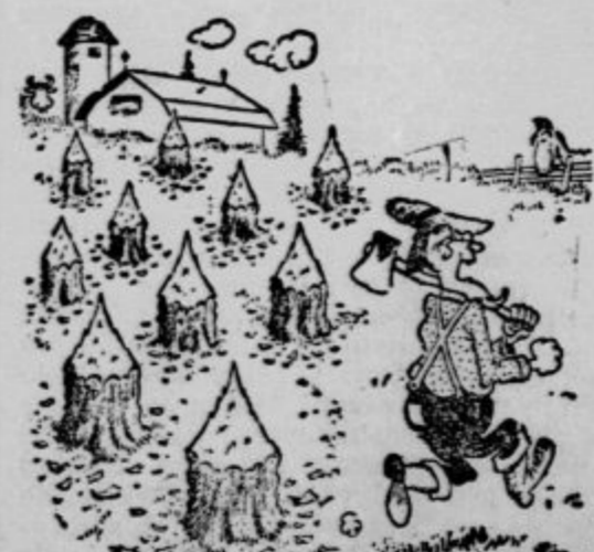
»Tako! Leni delavci ne bodo več posevali na štorih!« (Everybody's weekly)