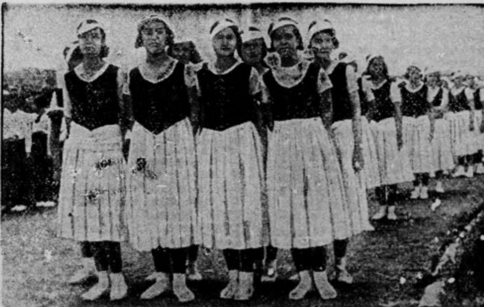
Turške sportnice v Kemalovi državi

»Naš narod ne sme v ničemer zaostajati za naprednejšimi državami! Preteklost do-