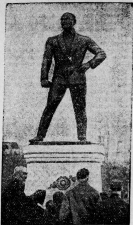
Najmonumentalniji spomenik Kemalu Atatürku v Turčiji

Kemalovi odlični osebnosti, fanatični vztrajnost in realnemu gledanju na življenje je uspelo, da mu je pridobil za svoje načrte silno zakrinjene anatolske kmete. Do tedaj Turki niso mislili turški, še manj