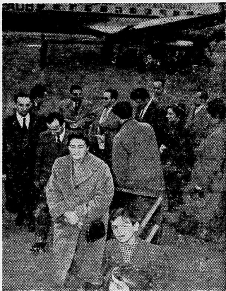
Na povabilo SZDL Jugoslavije je prispela v Beograd delegacija socialistične stranke Arabske preporoda (BASS). — Na sliki Sprejem delegacije na zemunskem letališču.

Stališče ameriškega javnega mnenja, časopisov in uradnih krogov v petih tednih obstoja prvega sovjetskega umetnega satelita in prvem tednu življenja drugega satelita navajajo domneve in tuje opazovalce k sklepu, da se bo vsa ameriška notranja in zunanja politika v prihodnjem obdobju razvijala v znamenju in pod vplivom tega epohalnega dogodka. Presenečenje je nastalo zato, ker je uspeh dosegla država, od katere tega niso pričakovali. Razočaranje nad tem, da so ljudje verjeli, kako nihče v ničemer ne more prekositi ZDA, prepredenost in strah pred morebitnimi negativnimi političnimi, strateškimi in drugimi posledicami — so se zdaj umaknili dobro organizirani množični dejavnosti v smeri pomirjenja. »Naša histeričnost zaradi »sputnika« je slabo vplivala, »Odpočijmo se in prižigaj si cigareto«, »Bodimo gospodarji samega sebe«, pišejo časopisi v komentarjih.