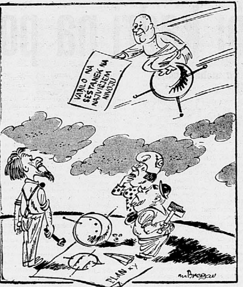
— HVALA, NE MOREMO; SMO SE PRENIZKO... —