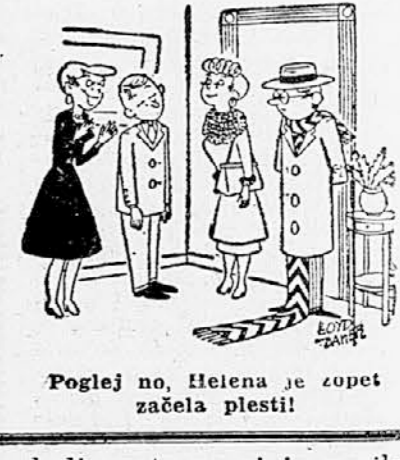
Pogled na Helena je zopet začela plesti!

komolcih odrgnjenim plaščem, okoli vratu pa si je zavila revno, obrabljeno krzno. Izpod odeje so ji na drugem koncu lezle noge in na obeh ponošenih čevljih sta v podplatih zijali okrogli luknji. S seboj je imela kaj malo prtljage: slabo zavezan, rjavkast papirnat paket. Položila si ga je pod glavo, pod to brezkrvno glavo, ki so jo obdajali razmršeni, kostanjevi lasje, pod glavo, ki se ni več premikala. Oči, za katere se je zdelo, da nič več ne vidijo, so bile kljub temu široko razprte, čisto steklene in kot pokrite s tančico.