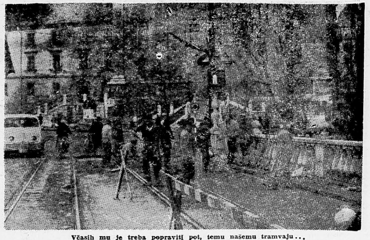
Včasih mu je treba popraviti pot, temu našemu tramvaju...

Vageningen, 11. nov. (Tanjug). Na mednarodnem cirkusu turnirju v Vageningenju se je nadaljevalo igranje prekinjenih partij iz prejšnjih kol. Naš velenjski klub Trifunovič je uspel zmagati obliko rambro šahovca Clarka in ga prisiliti k predaji. Rezultati ostalih prekinjenih partij so: Olafson : Larsen 0:1. Niephaus : Olafson 0:2. Tojanec : Olafson 0:2. Olafson : Uihmann : Stahlberg 1:0. Ulster : Henninen 0:1. Donner : Teschner 1:0. Teschner : Ulster prekinjeno. Olafson : Kolarov ponovno prekinjeno. Po IX. kolu je položaj na tabeli: Szabo 8.5. Larsen 7. Uihmann in Trifunovič 6.5. Donner 6. Stahlberg 5.5. Olafson 4.5 (2). Ivkov 4.5.