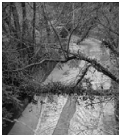
Zaraščena struga Korna