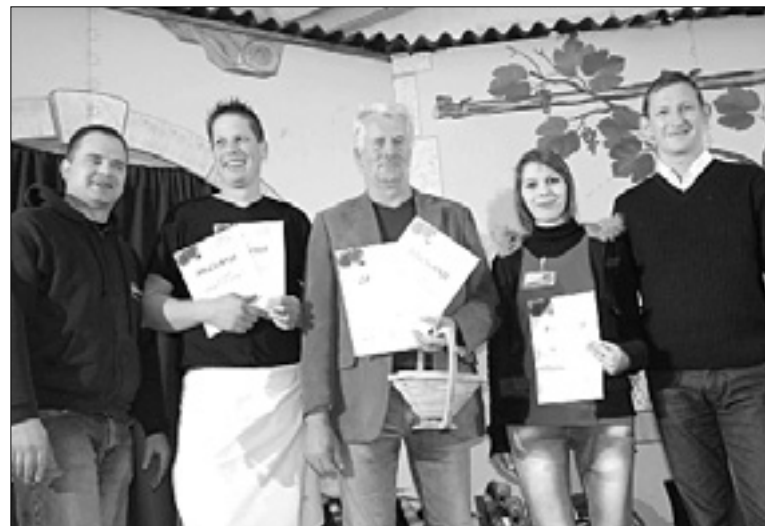
Nagrajeni za najboljše štrudlje