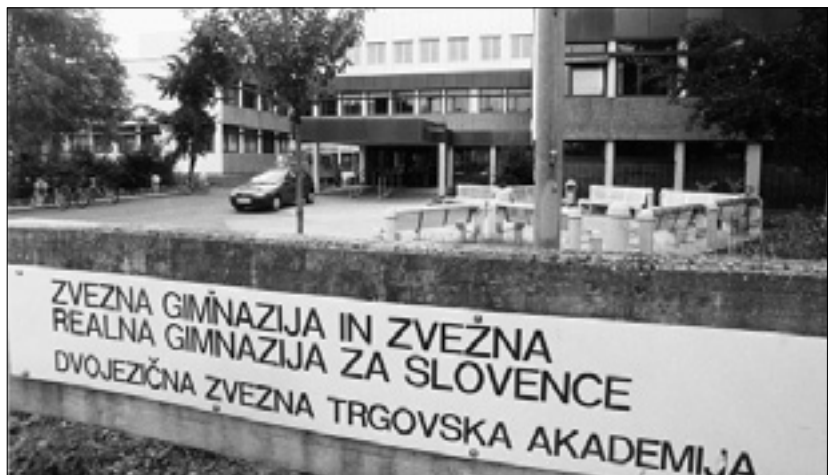
Poslopje slovenske gimnazije v Celovcu

CELOVEC – Slovenščina je na Koroškem očitno atraktivna kot še nikoli v preteklosti in je v novem šolskem letu 2013/2014 dosegla novo rekordno številko: k pouku slovenščine na osnovnih ter srednjih in višjih šolah je namreč prijavljenih več kot 4.000 dijakov in dijakinj.