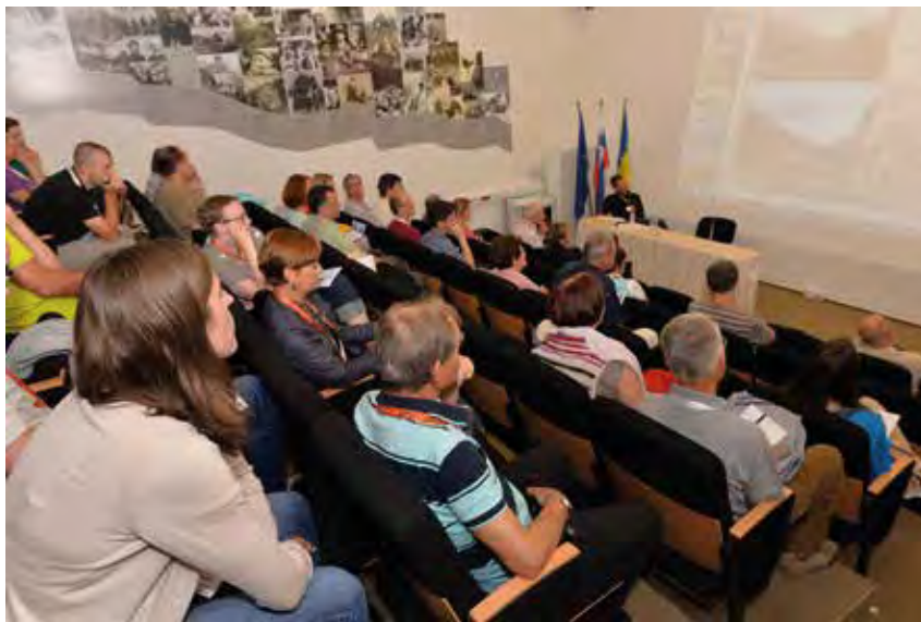
Avditorij posveta z udeleženci.

Ta spoznanja in védenja moramo nenehno prenašati na mlade generacije, vse od