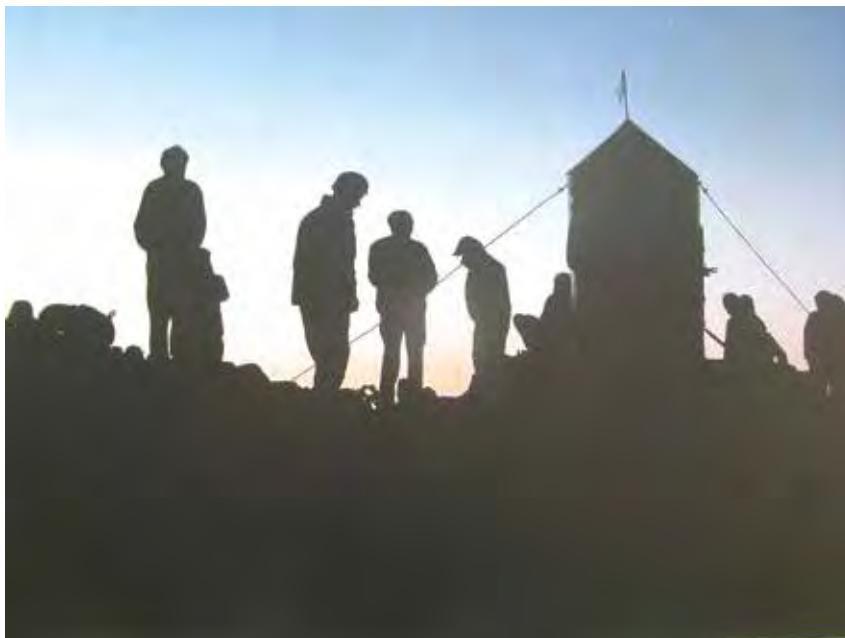
Gorniki pri Aljaževem stolpu ob zatonu večera.

času pa vzpon na njegov vrh pomeni izjemno doživljajsko izkušnjo ter duševno in duhovno sprostitev, hkrati pa tudi notranjo obogatitev.