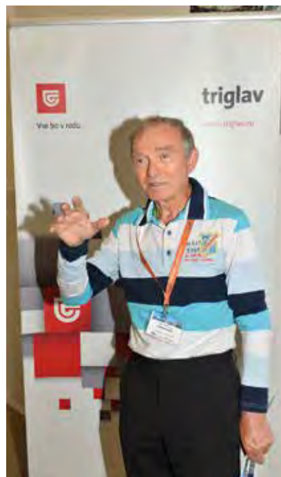
Avtor prispevka pred avditorijem.

Ko govorimo o športnem turizmu v povezavi s Triglavom in njegovim visokogorskim okoljem, moramo zaradi generacij Slovencev in Slovencev, ki prihajajo za nami, posebej upoštevati tudi načela trajnostnega športnega turizma. To v bistvu pomeni, da naj obiskovalci, posamezne izbrane dejavnosti, ki se izvajajo v navedenem gorskem okolju, torej pohodništvo, planinstvo, gornišstvo ali alpinizem, upoštevajo sedanje in bodoče ekološke vplive ter potrebe okolja in okoliškega prebivalstva.