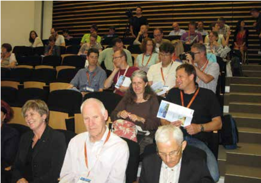
Bivši minister za kulturo Tone Peršak z udeleženci posveta.

in slaba tretjina (31,0 %) učencev. Oddaljenost šole ali kraja od Triglava prav tako vpliva na odnos do našega najvišjega vrha in posledično tudi do simbola Slovenk in Slovencev. Bližje, kot je kraj ali šola, več je zanimanja za Triglav in za poti, ki vodijo k njegovemu vrhu. Med odraslimi anketiranimi jih je 4,7 % že bilo na Triglavu, 39,0 % pa je bilo takih, ki to še nameravajo storiti.