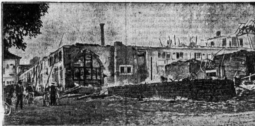
Grajsčina Hohenheim pri Stuttgartu je pogorela.

Absolventi filozofske fakultete morajo izdelati, predno postanejo doktorji modroslovja, znanstveno delo ali »disertacijo« o tem ali onem predmetu po dogovoru s profesorjem. Disertacija ima navadno obseg male brošure in treba je običajno nekaj mesecev temeljitega dela,