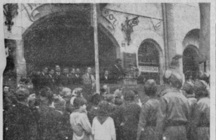
Predstavniki Arandjelovca, Čakovca, Ptuja in Varaždina na t-rbuni ob zborovanju na Trgu mladinskih brigad

Praznik 9. maj, 20-letnica osvoboditve, je dal Ptujčanom na razpolago več možnosti za udeležbo na raznih proslavah in prireditvah. Šolarji in učiteljsvo iz osnovnih šol Toneta Znidarčiča, Franca Osojnika in Ivana Spolenjaka so se zbrali v telovadnici šole »Toneta Znidarčiča«, kjer je bila skupna prireditev za vse tri šole in kjer je bil tudi skupen sprejem pionirskih delegacij iz šol Čakovce, Varaždin in Ormož. Te so prišle tokrat prvič na obisk sosednim šolam. Vsem trem prirediteljem in gostom vse priznanje za izredno uspešno prireditev, ki ni bila na višku samo po vsebini nastopov, temveč tudi po prisrčnosti med gostitelji in gosti, ob pozdravnih nagovorih in tudi ob razdelitvi spominskih knjig. Tudi učiteljske, ki so spremljale pionirske delegacije iz sosednih občin so bile s prireditvijo izredno zadovoljne.