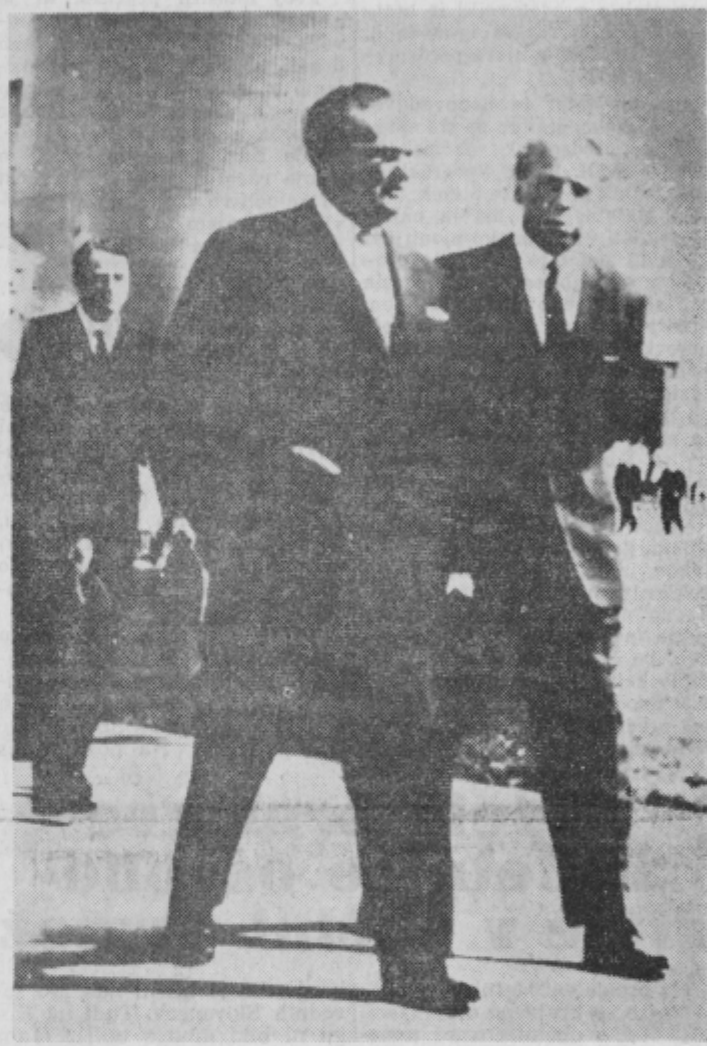
Predsednik Tito je na Norveškem obiskal atomski inštitut v Kjellerju

V sredo je jugoslovanski visoki gost obiskal severno mesto Trondheim, simbol jugoslovansko-norveškega prijateljstva med drugo svetovno vojno. V bližini tega mesta so namreč grobovi jugoslovanskih partizanov in internirancev v nacističnih koncentracijskih taboriščih. V kraju Moholtu je predsednik položil venec na spomenik jugoslovanskim borcem. Pozneje si je ogledal mestne znamenitosti Trondheima, nato pa se je zvečer vrnil v Oslo.