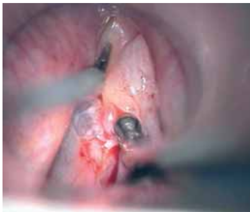
Slika 1a. Ekscizijska biopsija spremenjene sluznice glasilke po predhodnem injiciranju fiziološke raztopine v subepitelialno tkivo.

obravnavajo bolnika po protokolu se ne zdi smiselna, a vendar je dobro, da se držimo pri diagnosticiranju in zdravljenju vsaj tistih smernic, pri katerih ni dvoma.