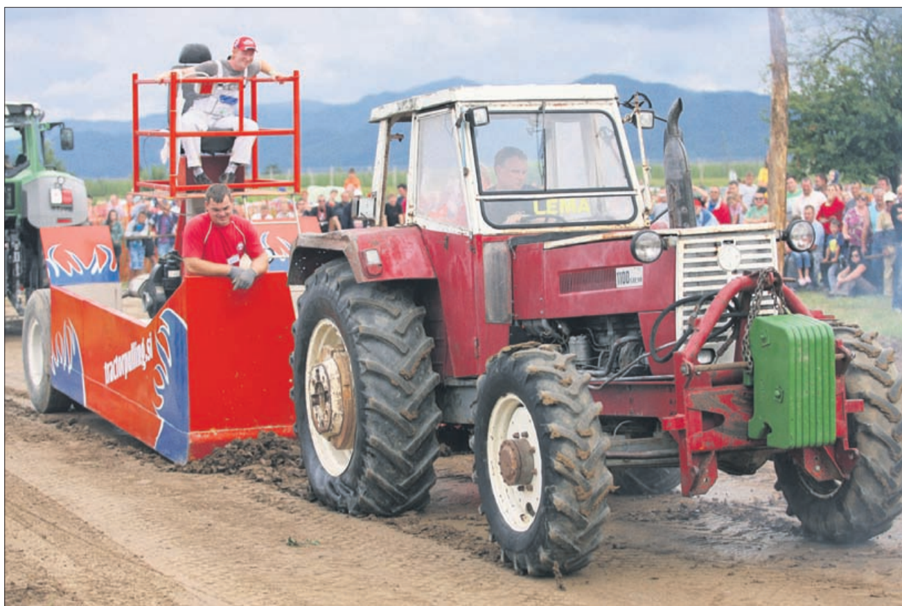
Tractor pulling. Počasi, izkušeno, zanesljivo in premišljeno proti magični meji 100 metrov. No, šlo je do 50 ...

lekcijo: gre za tekmovanje, v katerem traktorje uporabljajo za vleko težkih sani po progi. To je zelo popularen šport predvsem na podeželju (»A, bejž, no,« je ušlo Andražu). Vse skupaj se je začelo sredi 19. stoletja, ko so kmetijska orodja vlekli konji, kmetje pa so se med seboj izzivali, kdo ima najmočnejšega. Konje so vpregli kar v vrata hleva, nanje so poskakali ljudje in zmagal je tisti, ki je potegnil največ ljudi. Danes je zadeva videti precej drugače, saj traktorji vlečejo za seboj posebne sani in uteži, skupna teža lahko doseže tudi do 29 ton!