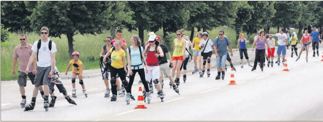
Rolanje je primerno za vse, tako otroke kot starejše, ženske, moške ...