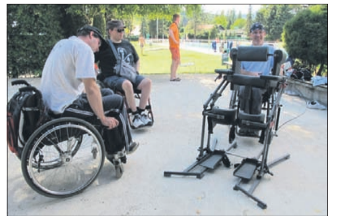
Predstavili so tudi potapljanje za invalide.

Prireditev je bila na konjiškem mestnem kopaljšču. Akcija je bila letos že osmič, njen namen pa je srečanje invalidov, ki si med seboj delijo izkušnje na področju drugačnih in mogoče tudi adrenalinskih načinov premikanja, pri katerih ne potrebujejo invalidskega vozička. Srečanje so organizirali kljub nekoliko slabšem vremenu, člani Mednarodne organizacije za potapljanje ljudi s posebnimi potrebami pa so predstavili tudi potapljanje za invalide.