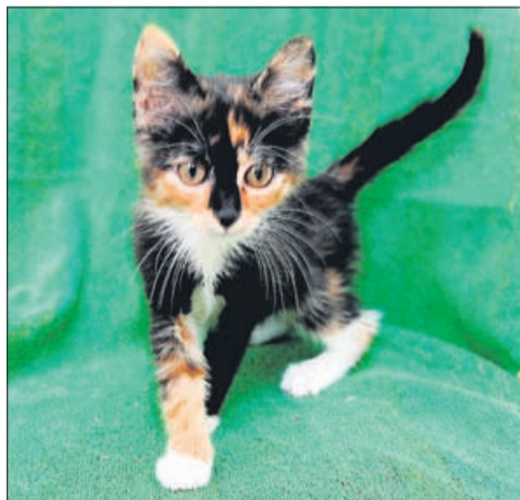
BIBA (samička, stara 3 mesece).