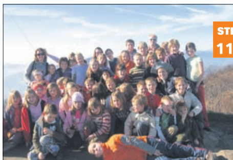
V hribih so starši največji problem