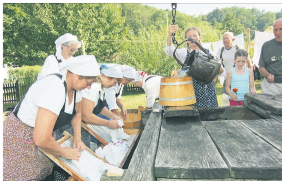
Ljudske pevke iz Rogatca so prikazale, kako so se mučile nekdanje perice.