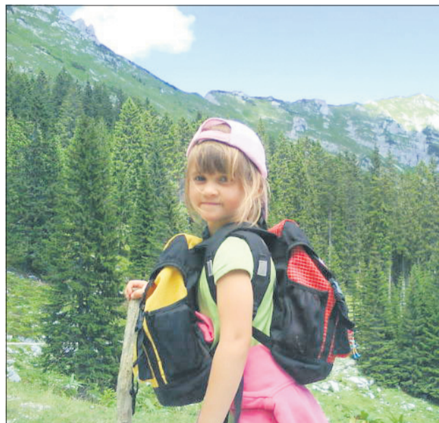
Čeprav se staršem včasih zdi, da je nahrbtnik za njihovega malčka v hribih čisto prehud napor, so včasih za pomoč prijatelju, sestri ali bratcu sposobni nesti celo dva.