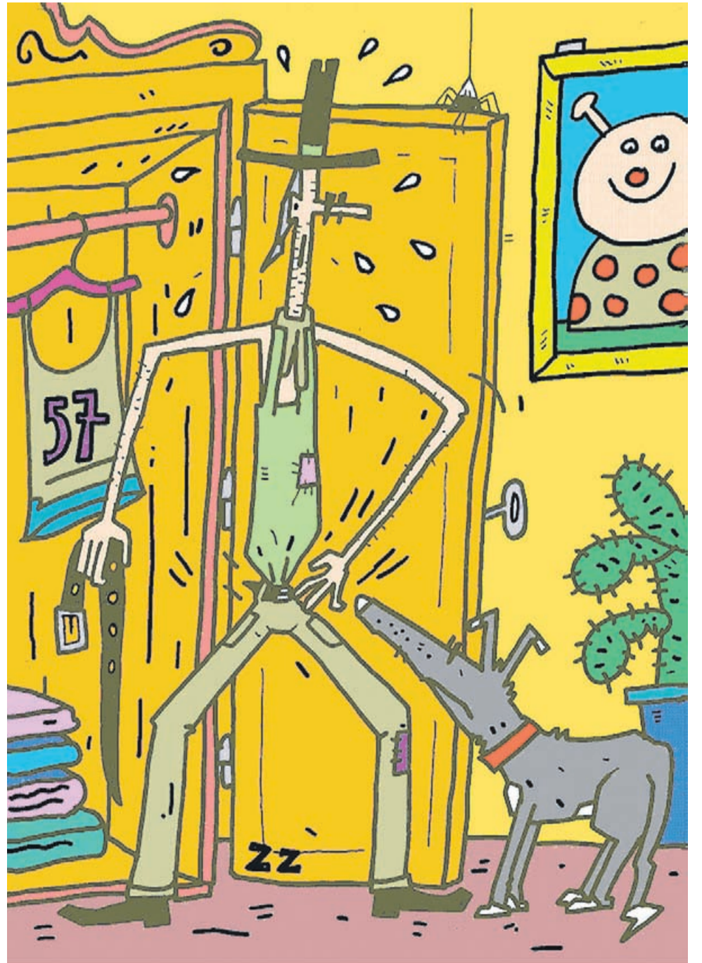
» Ne, to ni nikakršna shušjevalna, ampak le rebalans!«