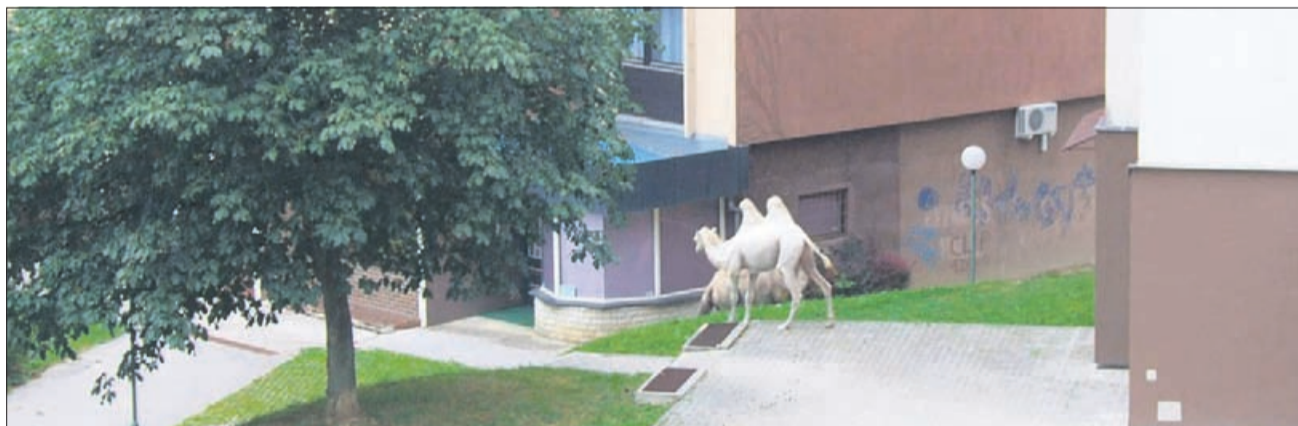
Živali so bile po »ugotovitvah« velenjskih občinarjev »v dobrem stanju, v senci in z izhodom na travnati del« ...