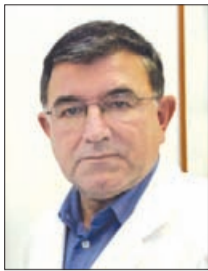
Piše: prim. JANEZ TASIČ, dr. med., spec. kardiolog

(losos, sardele, postrv, skuša) večjo vlogo pri preprečitvi bolezni srca kot bela riba (orada, tuna ...). Žene, ki uživajo kuhane ali pečene ribe, so po videzu bolj mladostne. So pa tudi fizično bolj aktivne in bolj privlačne. V povprečju uživajo tudi drugo bolj zdravo in varovalno hrano. Uživajo več sadja, zelenjave, več polnovrednih žit ... Žene, ki jedo več rib pripravljenih v »fritezi« (ocvrte), pa pogosteje kadijo, imajo prekomerno telesno težo, pri njih je indeks telesne mase povečan, imajo višji krvni tlak, pogosteje sladkorno bolezen in srčno popuščanje z motnjami ritma.