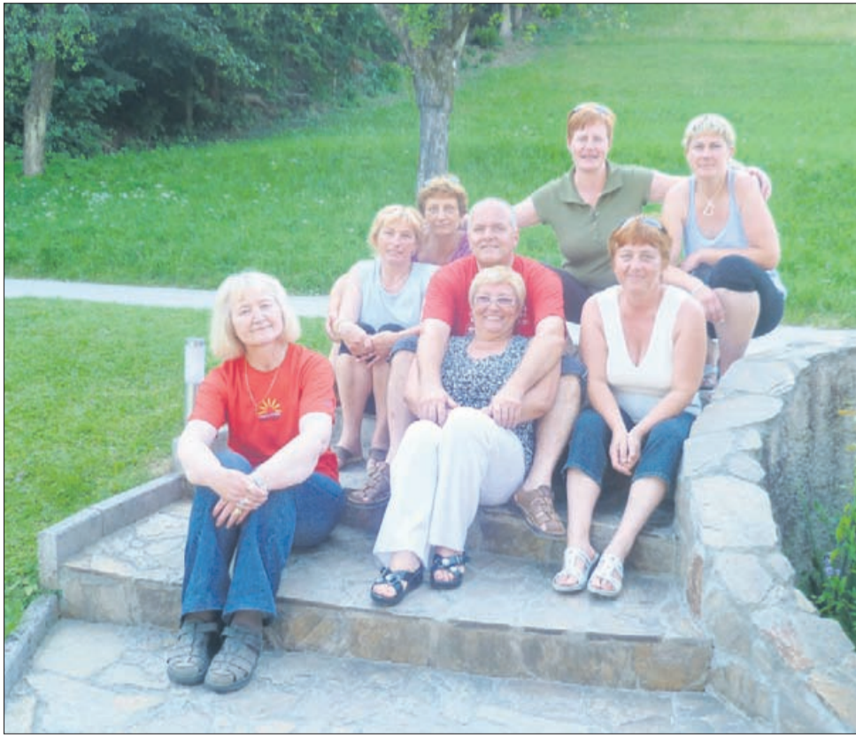
Vidno zadovoljni udeleženci piknika »hujšarjev«