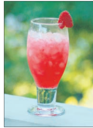
Malinovec za vroče dni

Zdi se, da dandanes gozdne maline ( Rubus idaeus ) zobajo le še ptiči, medtem ko ljudje raje kot v gozd zavijejo v kakšnega od številnih supermarketov in ne da bi se opraskali, kupijo kakršen koli