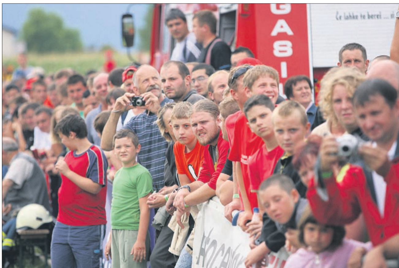
Poznavalskih komentarjev med razpoloženo množico ni manjkalo. »Tale bo potegnil do 80 metrov ... Kje pa, kvečjemu do 60.«

Je pa zato letos vse moje simpatije požel dečko, ki je uteži suvereno povlekel s svojim precej »antičnim štajerjem«. Tam nekje do častnih 50 metrov, do »stotke« ni šlo. Sicer se je pa stvar malo vlekla, ker so se »pobje« očitno naučili voziti bolj previdno, zato ni nobenega prekucnilo na zadnja kolesa, traktorske osi se niso trgale, nihče se ni zakopal v blato, med nastopi tekmovalcev so pazljivo »glancali« tekmovalno površino pogosteje kot na kakšni hokejski tekmi. Moto organizatorjev – vsem enakovredne pogoje! Gledalcev to ni prav nič motilo, sodeč po vzdušju so uživali vsako minuto.