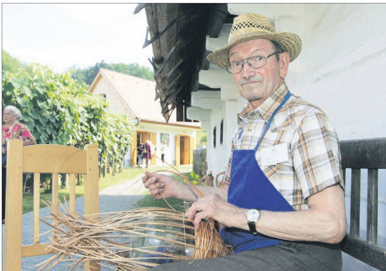
Opletanje steklenice. Tako so nastajale pletenke v okolici Šentjurja, od koder je prišel nastopajoči, ter po drugih krajih.