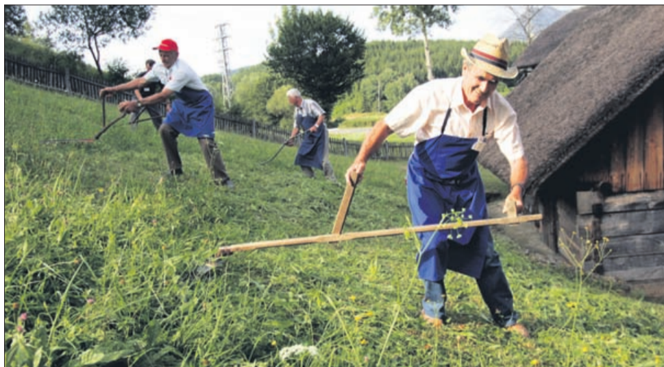
Kljub napornemu delu so se kosci včasih znali tudi pozabavati.