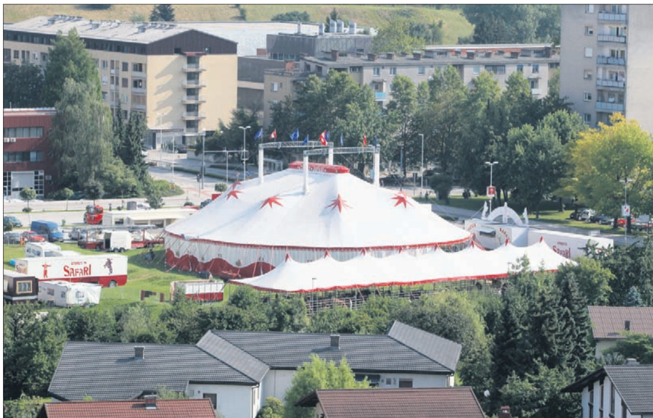
Odgovor MO Velenje: »To ni spalno naselje.«

66 let z vami in za vas VSAK TOREK IN PETEK facebook Novi tednik in Radio Celje www.novitednik.com