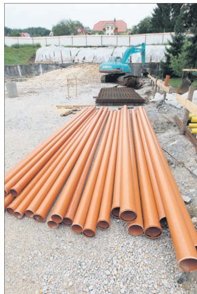
Dela na gradbišču novega vrteca so v Vojniku prejšnji teden začasno zaustavili, ker je treba poskrbeti za dodatno zaščito gradbene jame.

V zadnjih letih je vedno več protestov in opozoril nevladnih organizacij in društev, da v cirkusih za svoje predstave ne bi smeli uporabljati živali. »Sčasoma se je namreč že mnogo ljudi ozavestilo in informiralo o okrutnostih, ki jih za divje živali predstavljajo ujetništvo, dresura, siljenje v protinaravno vedenje, naporni prevozi ..., in sicer do te mere, da zavračajo tovrstno »zabavo« zase in za svoje otroke. Tako so cirkusi z živalmi prepovedani ali nezaželeni v mnogih evropskih državah (v Avstriji, Grčiji, Švici, na Švedskem, Finskem, Danskem, Norveškem) ter v okrajih, mestnih občinah in regijah po vsem svetu,« opozarjajo pobudniki spletne strani ljudjeza.org, v kateri sodelujejo tudi nekateri znani Slovenci. »Prav zato z veseljem pozdravljamo cirkuse, v katerih nastopajo trapezisti, vrvohodci, artisti, žonglerji, klovni, čarodeji, saj so že stoletja dokaz človekove telesne in duhovne sposobnosti. Za takšno plemenitost, zabavo in umetniški užitek mnogi veliki in slavni cirkusi ne potrebujejo izmučenih živali.«