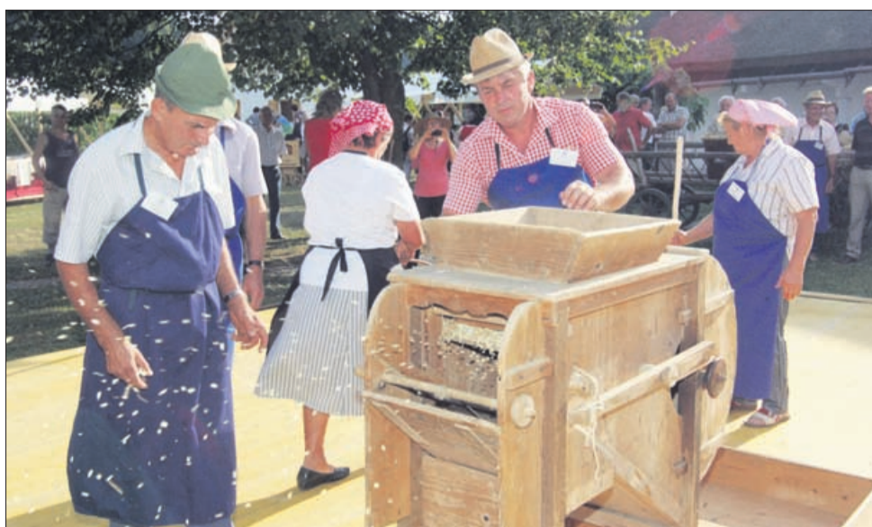
Ločevanje zrnja od plev. Kdo se še spomni »vejače«, kot pravijo tej napravi v Rogatcu?