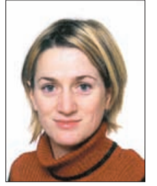
Piše: PAVLA KLÍNER

Že stari Kitajci so z malinami preprečevali kurjo slepoto. Bogate so tudi z vitamini skupine B, na primer z biotinom (B7), ki skrbi za napeto kožo in lesketajoče se lase, ter z vitaminom C. Naše babice vedo povedati, da če uživamo najmanj tri tedne