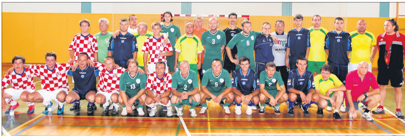
Ekipe Hrvaške, Bosne, Slovenije in Kralji ulice.