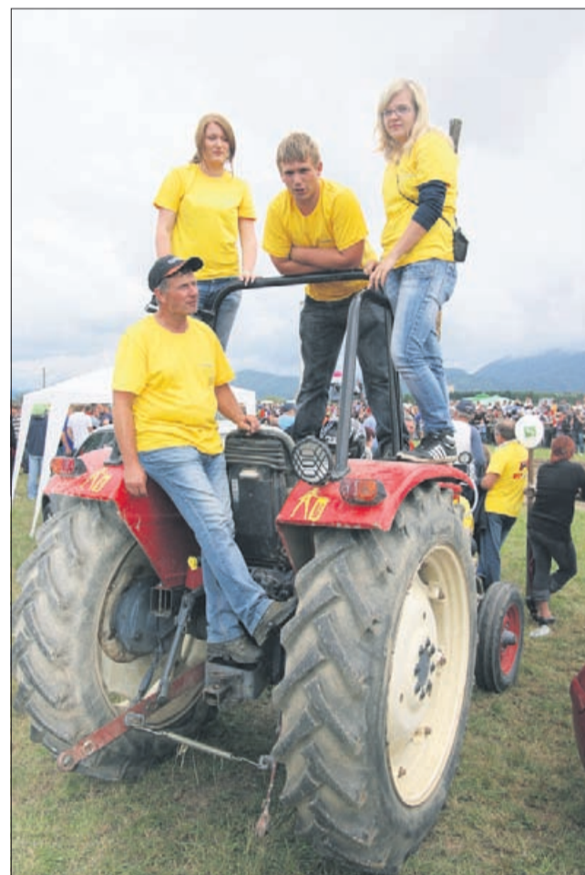
Navijači – naj se vidi daleč naokoli – v enotnih majicah!

Traktorski rokenrol! Letos v Gotovljah sicer z nekoliko manj pisano udeležbo. Prejšnja leta so nekateri ponosni lastniki svoje jeklene ljubljence ozajšali s cvetjem in duhovitimi napisi, še posebej simpatični pa so mi bili razni malodane muzejski primerki, ki jih še najdemo pod kakšnim senikom na našem podeželju. Lastniki so jih »zglancali« do visokega sijaja in se brez vsake sramežljivosti postavili ob bok kromiranim pošastim, večinoma pripeljanim iz tujine. V Italiji in Avstriji namreč ta šport dosega še veliko resnejše razsežnosti.