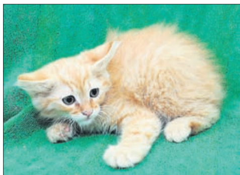
MURI (samček, star 3 mesece, najden v Velenju).