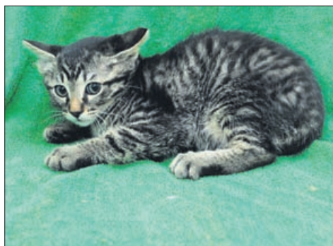
GEA (samička, stara 3 mesece).

Uradne ure zavetišča Zonzani: od ponedeljka do petka od 8. do 16. ure; ogledi psov: od ponedeljka do petka od 12. do 16. ure. Telefon: 03/749-06-00; internetni naslov www.zonzani.si