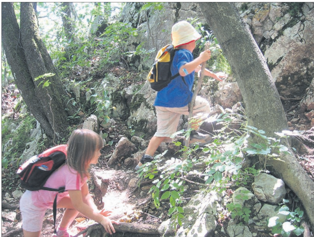
Izkušnje kažejo, da v hribih otroci nimajo težav niti z nahrbtniki niti s potjo. A ko so zraven starši, je vse drugače. Malčki naenkrat ne znajo več pobrati ne jakne ne papirčka in ne morejo nesti nahrbtnika in ne prav stopiti. Zato so programi ciciplanincev še posebej dobrodošli.