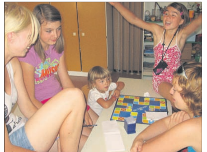
Otroci so delček počitnic zapolnili z druženjem, ustvarjanjem in igrami.