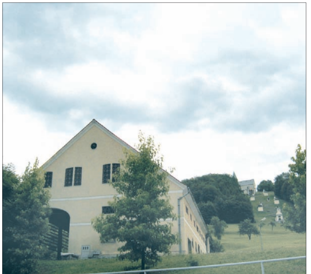
Muzej baroka bo v središču Šmarja pri Jelšah, v nekdanjem župnijskem gospodarskem posloplju, ki bo dobilo prizidek. V ozadju znamenita kalvarija.