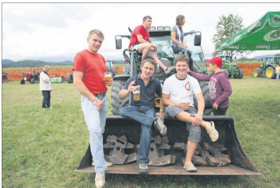
Čakanje na nastop se zna zavleči, obvezne so tudi »tekoče« priprave.