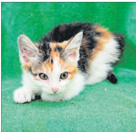
GIZA (samička, stara 3 mesece, najdena v Velenju).