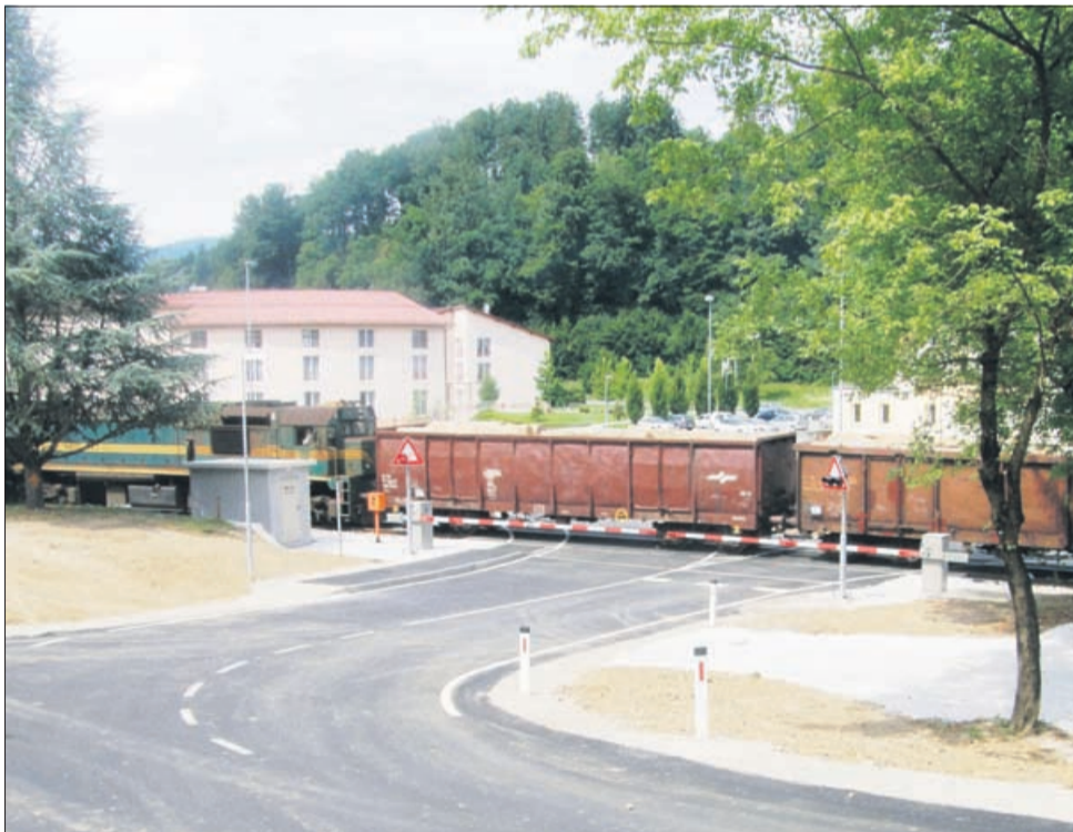
Doslej najnevarnejši prehod čez železniško progo v Rogaški Slatini, pri nekdanjem Mizarstvu Rogaška Slatina, končno varujejo avtomatske zapornice.