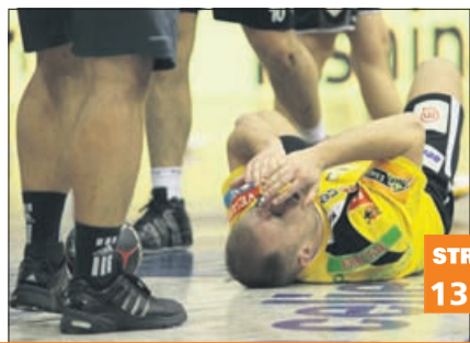
Črni oblaki nad celjskimi rokometiši