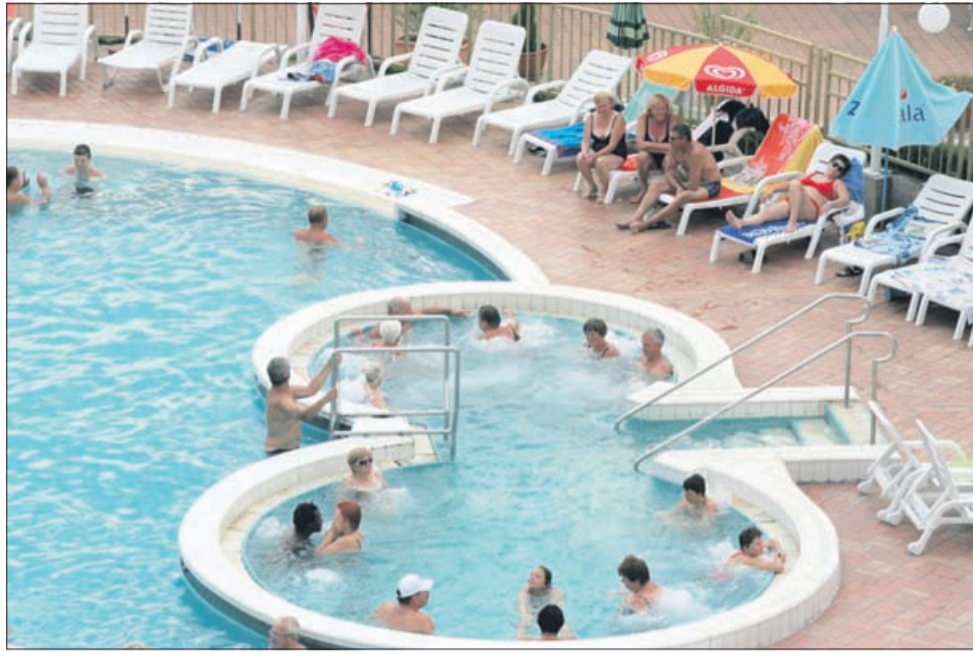
Zdraviliško zdravljenje bo po reformi plačano le, če bo neposredno vključeno v zdravljenje oziroma se bo zdravljenje nadaljevalo takoj po odhodu iz bolnišnice.

Zavarovalnice je zmotil tudi predlog, da bi se participacija določila na podlagi dohodninske napovedi. Sprašujejo se, kaj bi to pomenilo za zavarovance, glede na to, da bi participacijo potemtakem določali za nazaj. Če bi torej zavarovanec v preteklem letu zaslužil več kot v letih prej in bi bil razvrščen v višji razred,