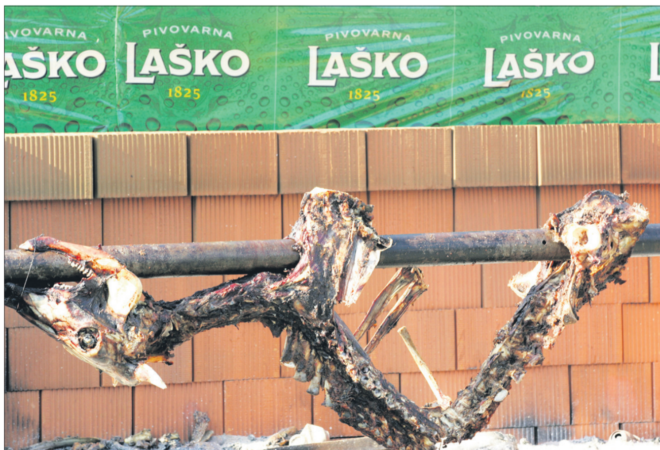
Obran do kosti