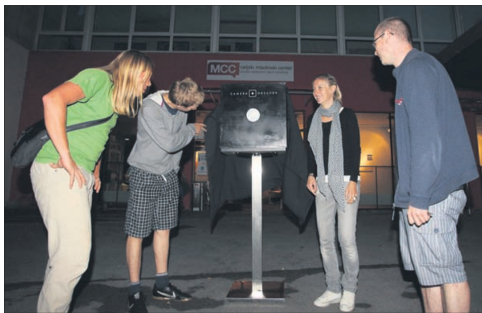
Pravi magnet za udeležence delavnice in za radovedneže je bila Camera obscura. Njen nenavaden svetlobni učinek so izrabljali tako za fotografiranje s fotoaparati kot tudi kar neposredno na fotografski papir.