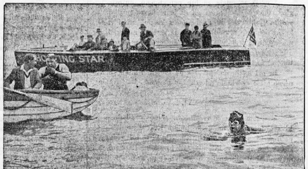
19letno dekle je preplavalo Rokavski preliv.

Na angleškem letališču v Croydonu se je ponesrečilo neko veliko belgijsko potniško letalo. Nesreča je zahtevala dve človeški žrtvi.