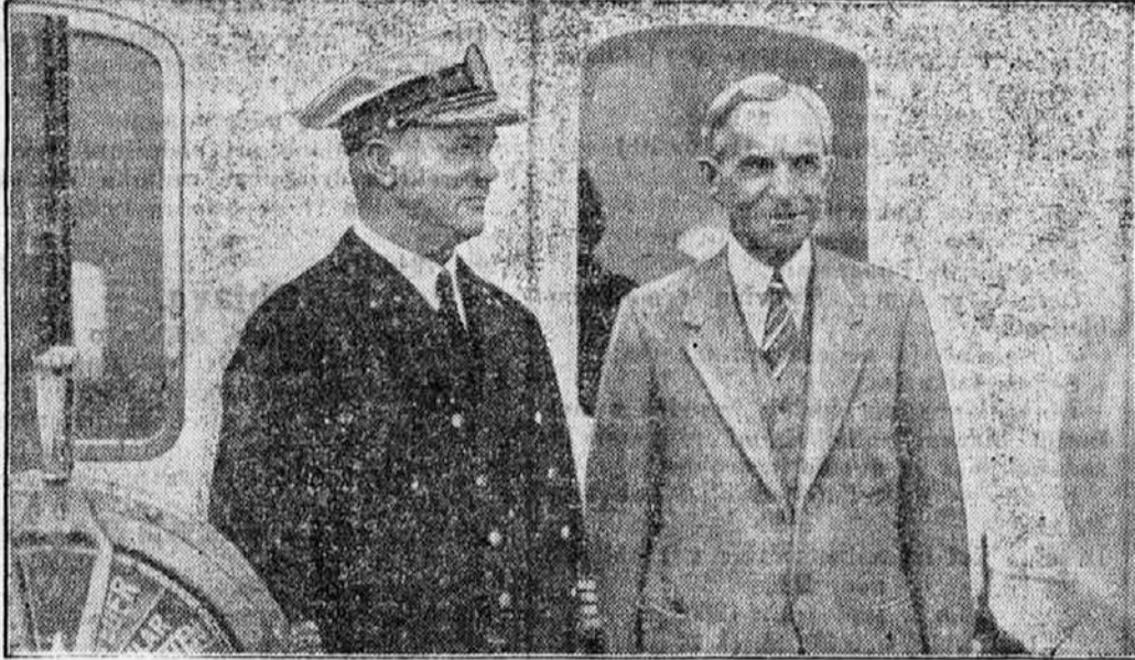
Henry Ford v Evropi.

Stephenson pa je moral še enkrat v boj, predno je svoj namen popolnoma dosegel. Ko so sklenili zgraditi železnico Liverpool—Manchester, so se staroverski nazadnjaki vzeli z vso silo za to, naj vozijo konji. Stephenson pa ni odnehal in železnica je res razpisala več nagrad za najboljšo lokomotivo. Zmagal je Stephenson, s svojim strojem »Rochette«, ki je vozil za takrat s neverjetno brzino 40 km na uro. Tega dne je nastopila parna lokomotiva svojo zmagovito pot.