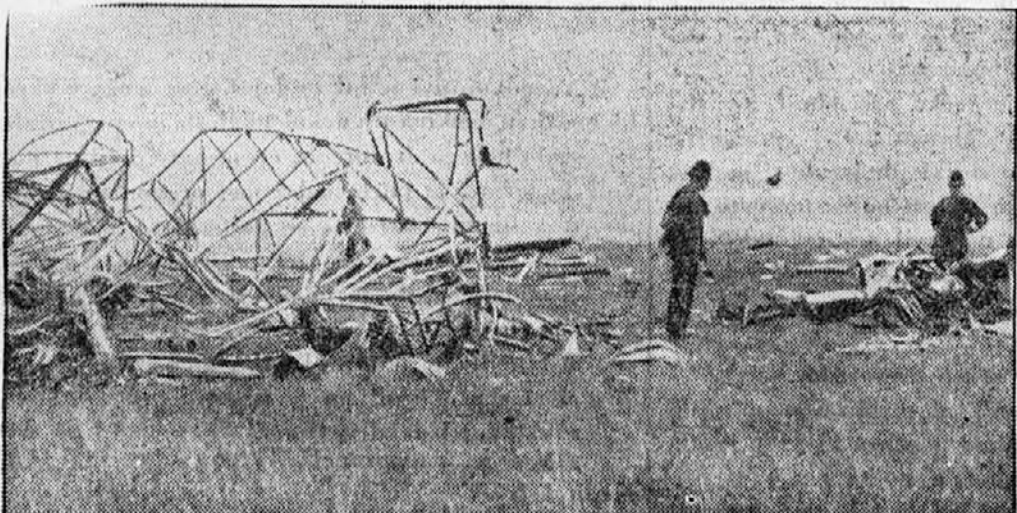
Letalska nesreča v Croydonu.

Ognjenik Stromboli leži na liparskem otoku enakega imena. Dolgo časa je miroval, nedavno pa se je zopet odprl. Tok lave je dosegel vas San Bartolo, kjer je zgorelo več hiš, zgorelo je pa tudi 5 ljudi.