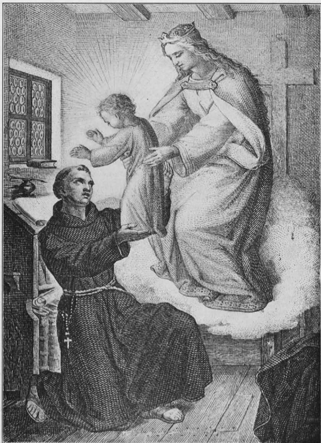
Sv. Anton Paduanski, prosi za nas.