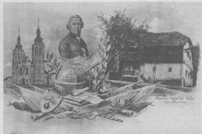
Vegova spominska razglednica z matematikovim portretom, rojstno hišo v Zagorici (desno), moravsko cerkvi (kjer je bil Vega krščen) ter simboličnimi znaki njegovega vojaškega poklica in matematičnega dela