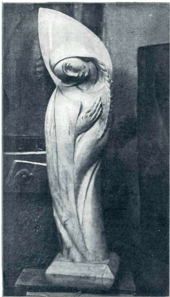
FRAN KRALJ: MADONA.