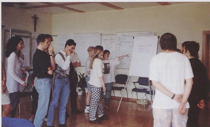
Med delom na seminarju v Tinjah. Seminarja so se udeležili predstavniki finske manjšine na Švedskem, Dancev iz Nemčije, Zahodnih Frizijcev, Ircev, Valežanov, Bretoncev, Baskov, Kataloncev, Asturijcev, Gradiščanskih Hrvatov, Furlanov in Slovencev iz Avstrije in Italije.