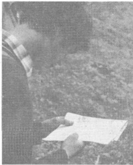
Kam sedaj? Karta tudi vedno ne pove vsega in znajti se moraš sam.

VETERINARSKI ZAVOD KRIM GROSUPLJE DE LJUBLJANA VIČRUDNIK ŠTEVILKA DEŽURNE SLUŽBE TEL. 268-543 – neprekinjeno 24 ur ŠTEVILKA SLUŽBE OSEMENJEVANJA GOVEDI TEL. 268-543 (NAROČILA OD 7. DO 8.30)