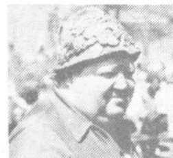
»Nič nimamo proti, če kanec vsega tega veselja ostane tudi za ostale dni.« je sredi najživahnjšega tabornega vrveža porekel nek Polhograjec. »Vse te naravne lepote tod okoli so na voljo vsakomur.«

»Blagajana«, čeprav brez večjih izkušenj, je tako vsekakor uspešno prestala svoj test. A tako kot to, prizadevno in vsestransko društvo, bržčas tudi sama turistična ponudba v kraju, ki se vedno pluje v širokem toku neizkoriščenih možnosti.