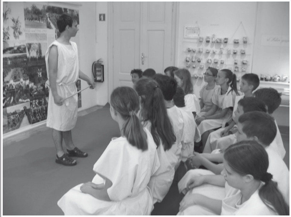
Učna ura Antična Emona 12. junija 2015 v SŠM.