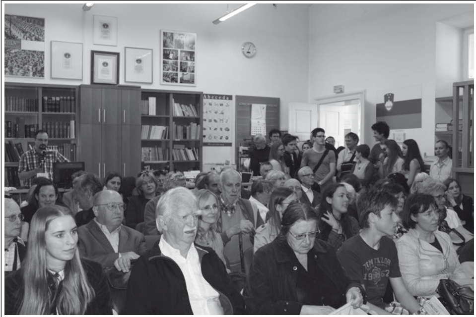
Odprtje razstave Lingua Latina 28. maja 2015 v SŠM (hrani SŠM, fototeka, foto K. Guzej).