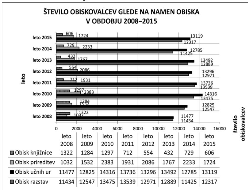
Graf: Število obiskovalcev glede na namen obiska 2008–2015

med ponudbo muzeja in potrebami obiskovalcev se je tudi v letu 2015 pokazalo med dnevi odprtih vrat, ko je zasedenost učilnice za brezplačne učne ure kar nekajkrat preseгла dovoljeno in še sprejemljivo število aktivnih obiskovalcev.