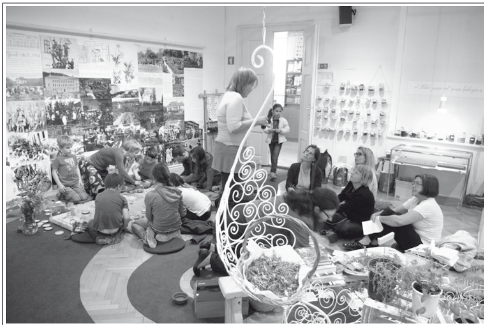
Poletna muzejska noč 20. junija 2015 v SŠM.