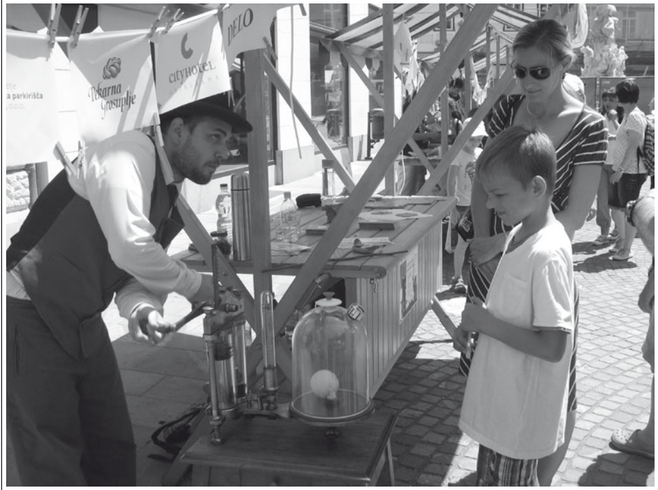
Znanstval 7. junija 2015 na Tromostovju.