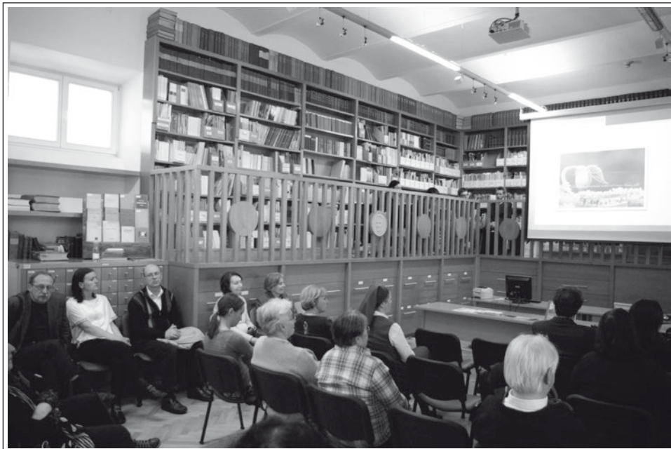
Pomladni dan v SŠM 1. aprila 2015.