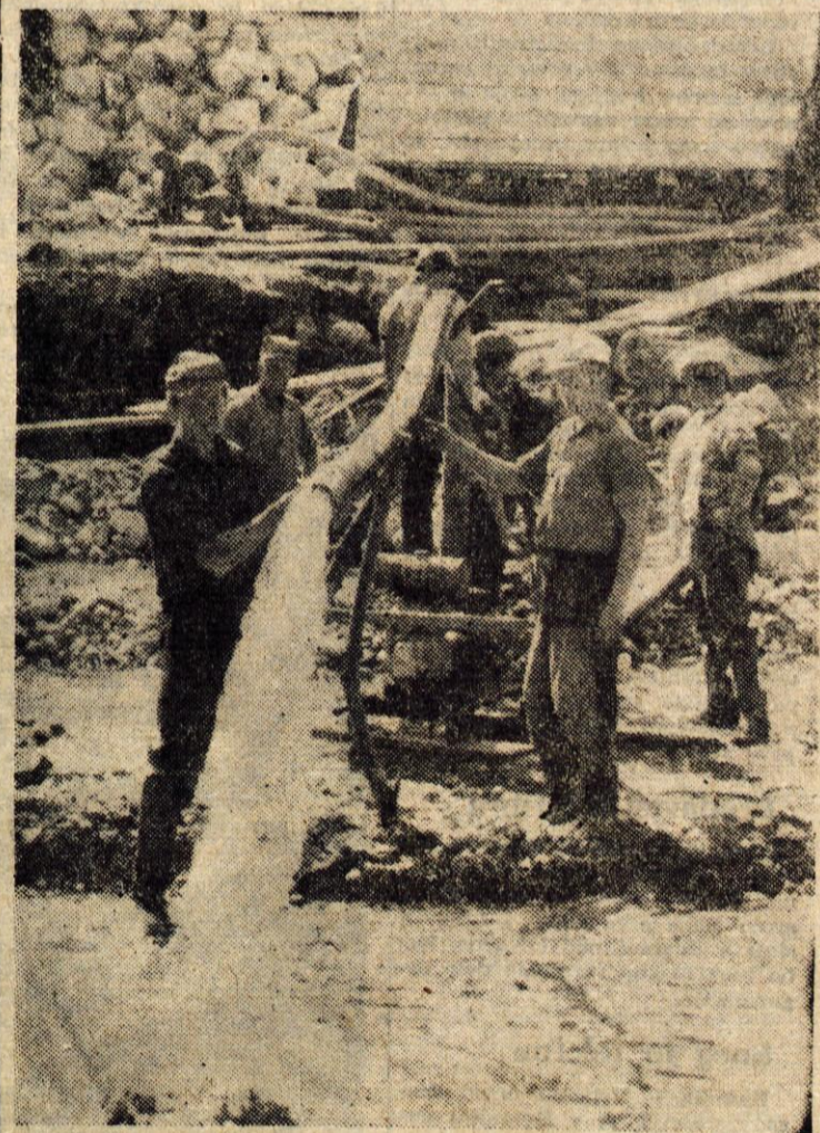
Podjetje za urejanje hudournikov Ljubljana ima pridne in požrivalne delavce. Ti jezijo potok Ljubič pri Kropi na Gorenjskem. Naša slika jih prikazuje pri urejanju vode, ki jim je velika ovira pri delu

Popis prebivalstva Kamnik - Za popis prebivalstva v kamniški občini bodo potrebovali 76 popisovalcev. Posebna komisija je že razdelila občino na popisne okoliše.