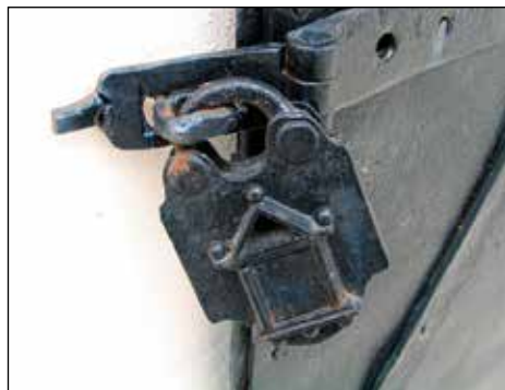
Kovana ključavnica na vratih.