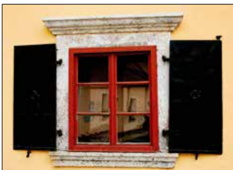
Značilna oblika oken Poldetove hiše s kovinskimi polkni in kamnitim okvirjem. Stavbni elementi iz 17., 18. in 19. stoletja.