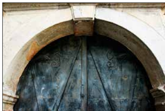
Detajl zgornjega dela portala in kovinskih vrat.