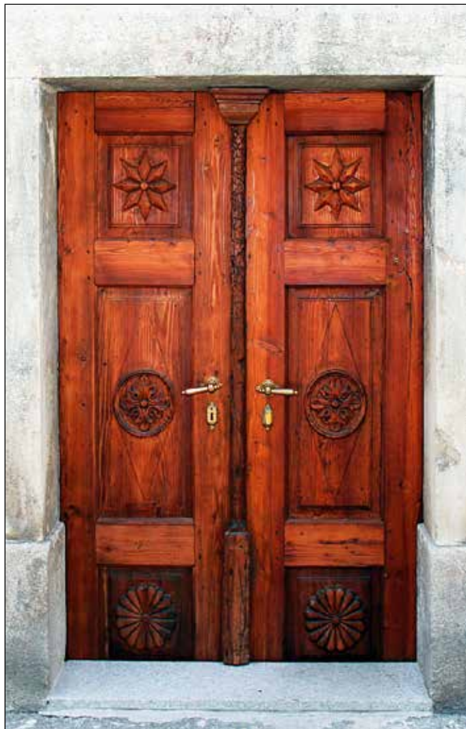
Vhodna rezljana vrata Antonove hiše na Racovniku 47 v Železnikih.