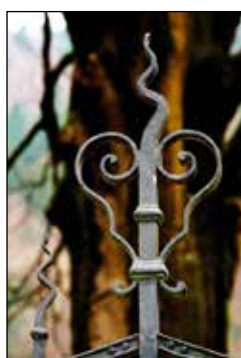
Detajli kovane ograje Egrovega vrta.