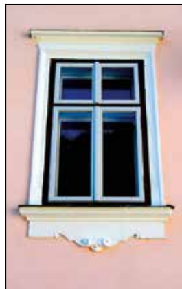
Značilna oblika oken Antoneve hiše v spodnjem delu z dodatkom okrasne štukature.