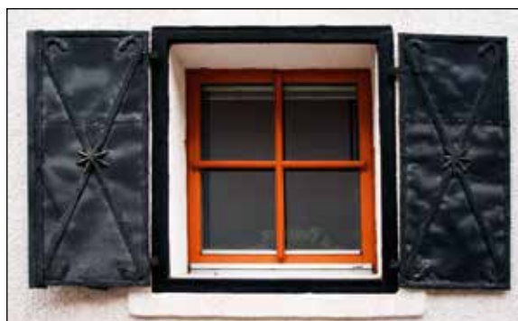
Značilna, kovana polkna na Drožjevi hiši, Racovnik 49 v Železnikih.