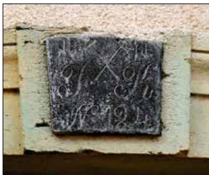
Vrhnji srednji del portala z napisom.