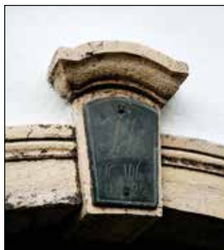
Zgornji srednji del portala z napisom.