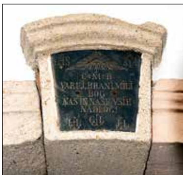
Detajl zgornjega srednjega dela portala.