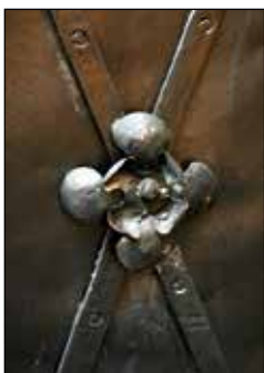
Detajl kovanih dodatkov na polkni.