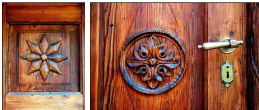
Detajla vhodnih rezljanih vrat.