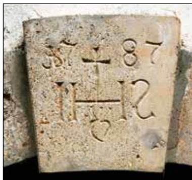
Detajl osrednjega dela portala nad vhomom Logarčkove hiše.