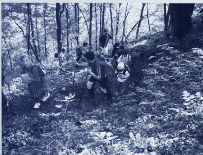
...pa spet v hrib!