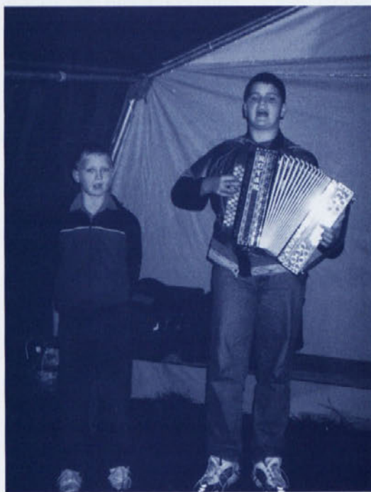
Na koncu poti sta udeležence sprejela mlada muzikanta, brata DIM.