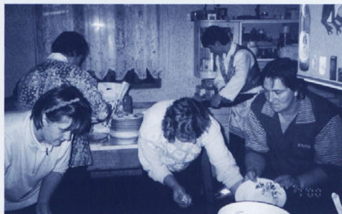
Medtem so pridne ženske roke hitele s pripravljanjem dobrot

jevnih in občinskih svetnikov, župana in ustreznih strokovnih služb, se zadeve ne bi odvijale tako kot se. Že res, da imamo ta trenutek tudi nekaj dolga, vendar sem optimist!"