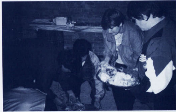
Tudi na Križnem Vrhu bi bilo brez pridnih ženskih rok bolj prazno.