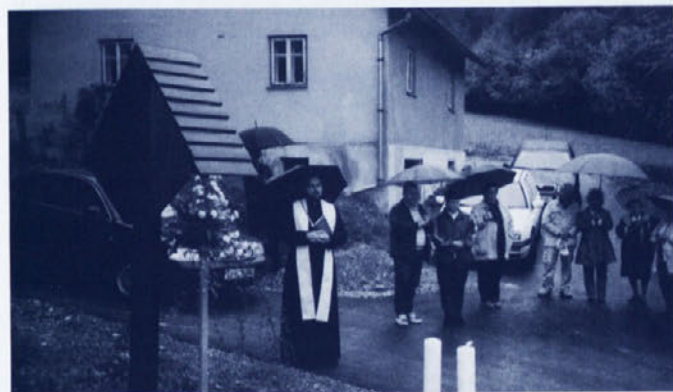
Z blagoslovom in obnovljenim križem bo cesta varnejša. Obred je opravil mokronoški župnik Klavdio PETRCA.