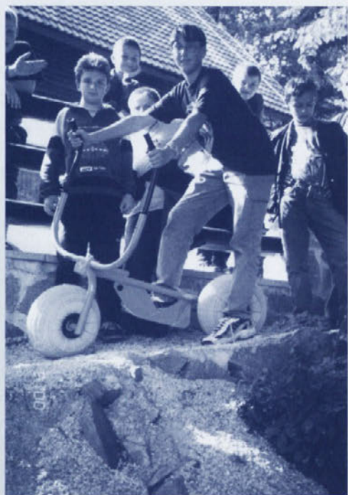
To pa nadomesti tudi punco!