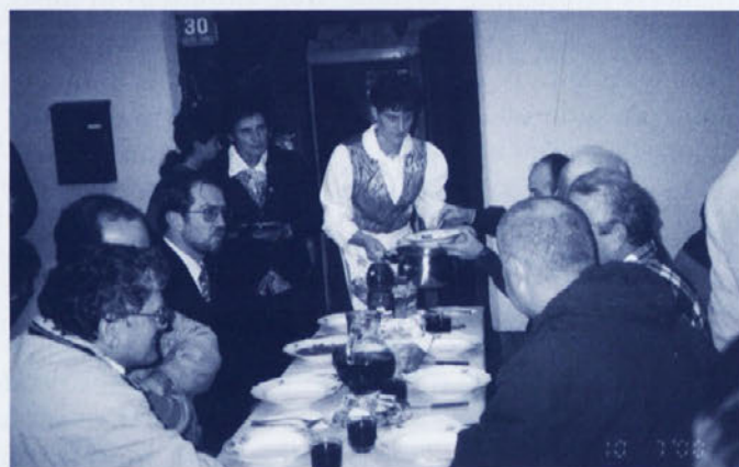
"Gospodje, sedaj pa konec s politiko!" je rekla domačinka in možakarji so jo z veseljem ubogali.