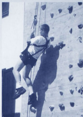
Hvala bogu, da sem privezan!