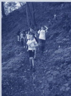
Najprej v dolino...