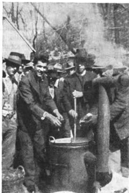
Kuha voska na enodnevem čebelarskem tečaju v Lendavi v Prekmurju.