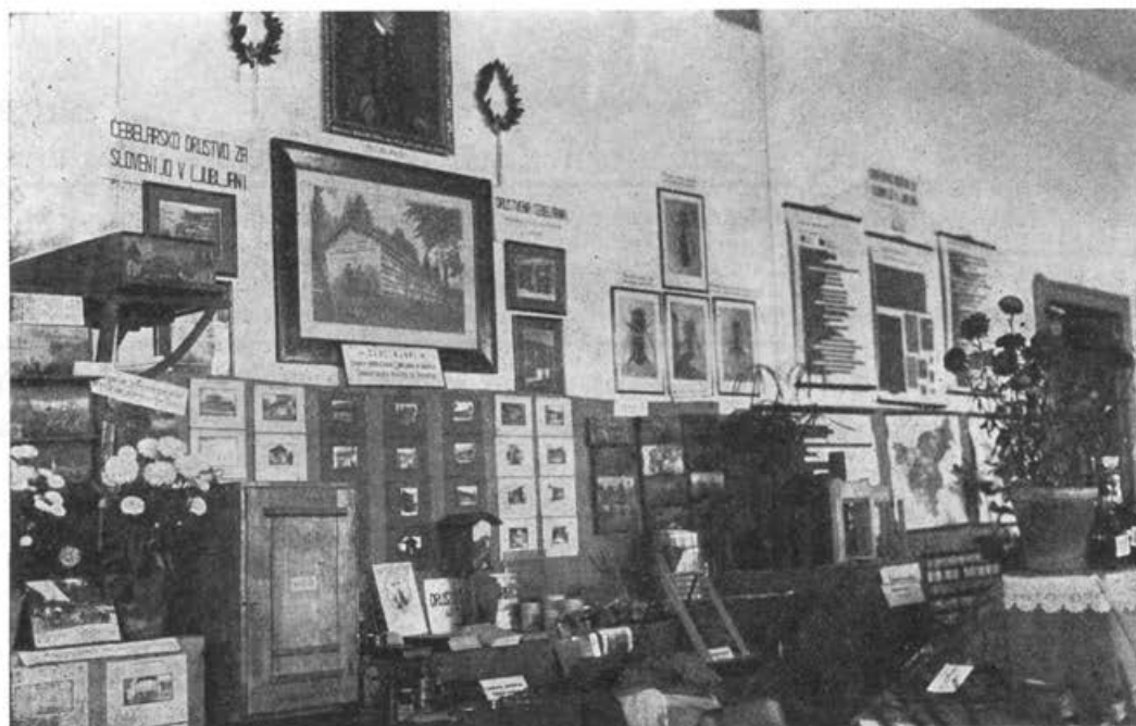
Del skupine predmetov Čebelarskega društva za Slovenijo na razstavi v Beogradu.

Vendar je zmagala ideja slovanske skupnosti, to skupnost je pa treba prenesti tudi na gospodarsko polje, zato je zaklical: s čebelarstvom za slovanstvo.