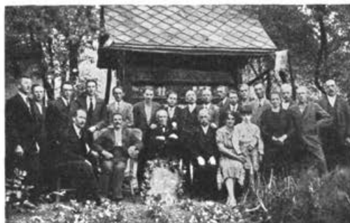
Proslava 80 letnice čebelarja Virjenta na Vrhpolju.

larne v Konjicah, ni bila odobrena, ker posluje na Stajerskem itak že več takih podružnic.