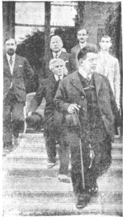
francoska delegacija z ministerskim predsednikom Herriotom.