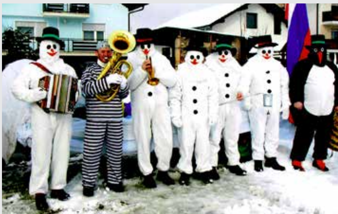
Pustni torek na Prevojah

Med stare kulturne običaje spadajo tudi pustni običaji, ki so v Zlatem Polju še vedno živi. Tudi letos smo jih obnovili in tako počastili pusta, za katerega pravijo, da odganja zimo, seveda če se mu to posreči.