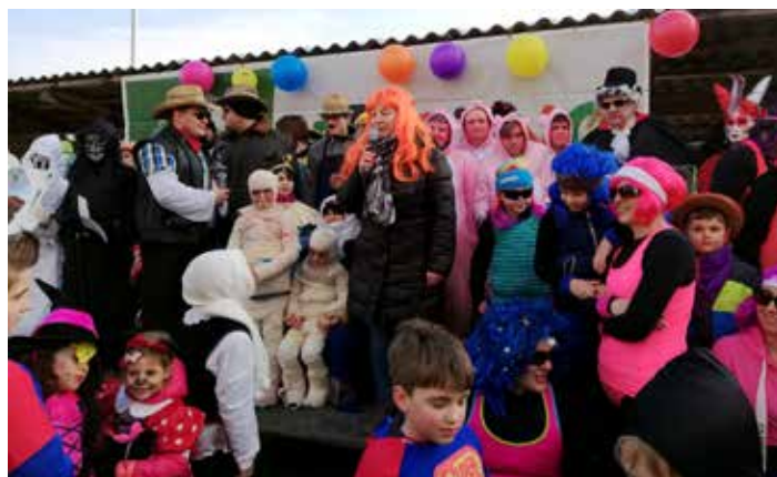
Na zmagovalnem odru