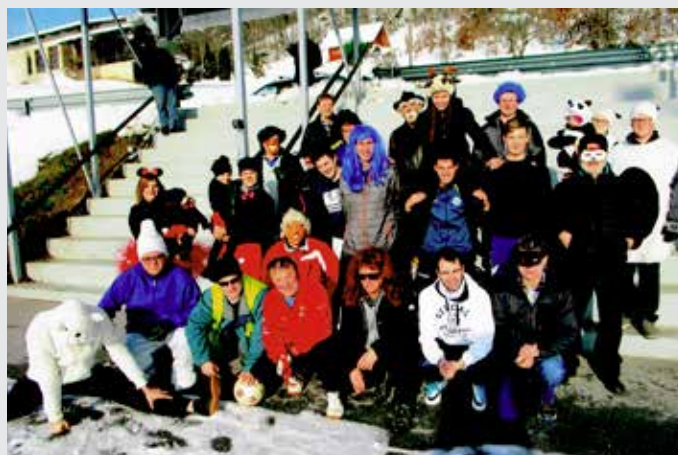
Pred nogometno tekmo s Prevojami

Čeprav je bilo igrišče prekrito s snežno odejo, smo bili na letošnjo nogometno tekmo v pustnih maskah še posebno ponosni. Moram povedati, da je bilo to že petindvajseto srečanje zlatopoljske in prevojske ekipe. Za prijetno sodelovanje in druženje vsa ta dolga leta se moramo zahvaliti tudi Božu Po-