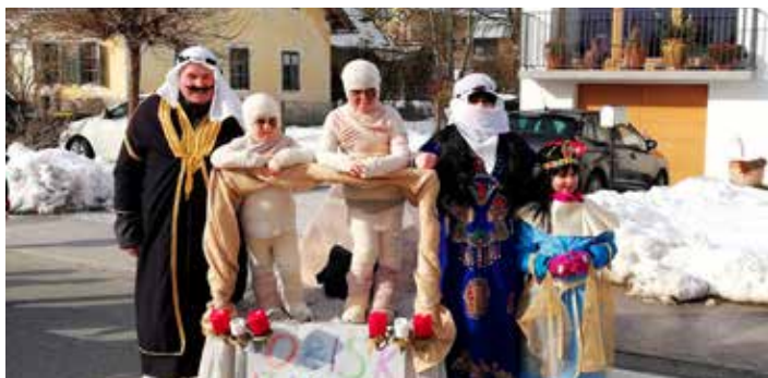
Zmagovalna družina Egipčanov