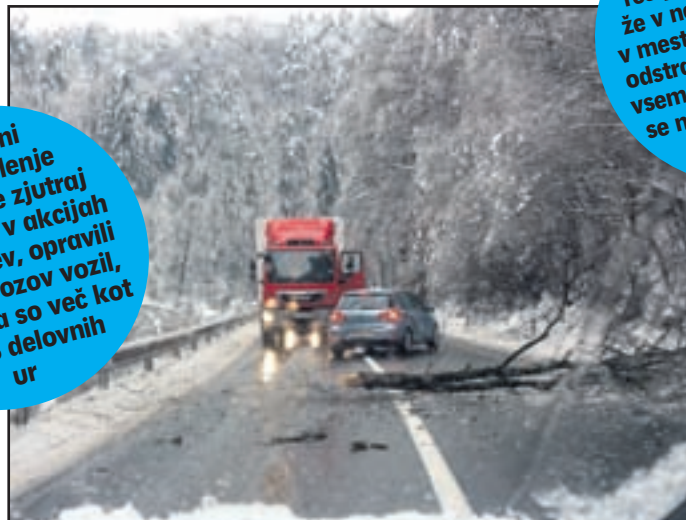
Na cesti proti Arji vasi so imeli sicer dve gasilski dežurni ekipi, a so drevesa, ki so nenehno padala na cestišče, občasno vseeno ohromila promet.