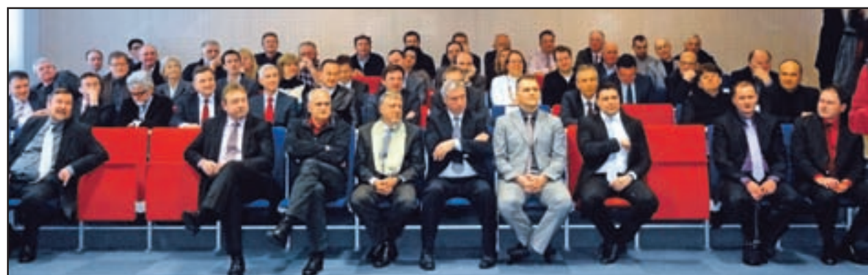
Na ponovnem srečanju so poslovnim partnerjem predstavili uspehe in načrte skupnega dela