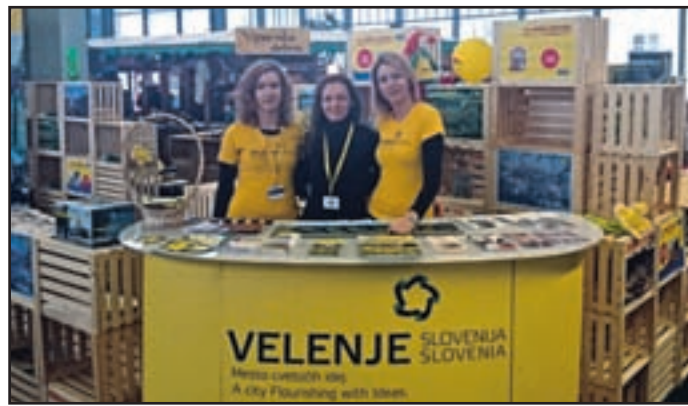
Poleg zaposlenih v velenjskem TIC-u so na sejmju sodelovala številna društva, javni zavodi in zasebni ponudniki. Največ zanimanja je bilo za letošnji Pikin festival in ponudbo podeželja.

Velenje - Ljubljana, 2. februarja – Tudi letos se je Mestna občina Velenje predstavila na sejmju Alpe-Adria – Turizem in prosti čas, ki je vsako leto že tradicionalno konec januarja na Gospodarskem razstavišču v Ljubljani. Letos se je na sejmju predstavilo 248 turističnih ponudnikov iz 12 držav. Vodja velenjskega Turistično