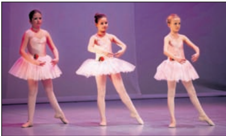
Množica mladih plesalcev v baletnih copatkah je s svojimi kostumi in mehkiimi gibi prevzela tudi gledalce v velenjskem kulturnem domu.

Po predstavi se ansamblu verjetno obeta še gostovanje v Cankarjevem domu, saj si je predstavo ogledal