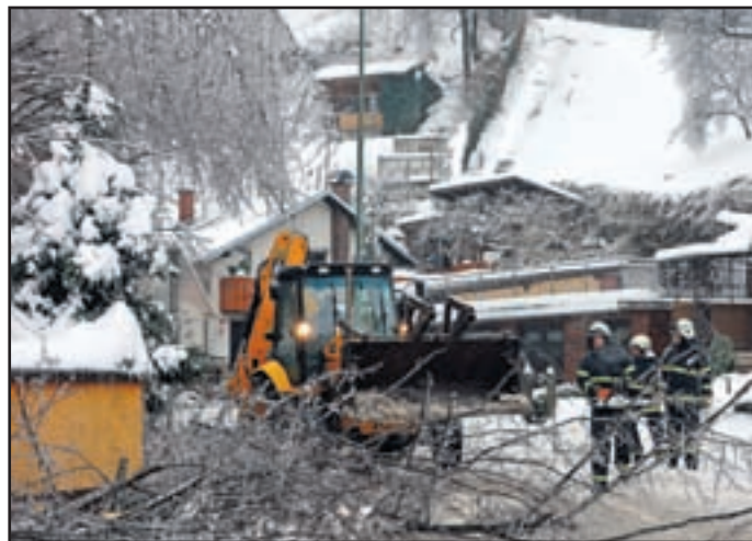
Nekaj časa je bila zaprta cesta tudi v Starem Velenju, a so gasilci in vzdrževalci cest padlo drevo hitro odstranili.

ali sploh neprevozne. Drevesa so padala nanje. Skorajda jih ni bilo mogoče sproti odstranjevati. Zaradi izrednih vremenskih razmer je za celo državo veljal rdeči alarm. Grozljive so se žal uresničile. Nastala je ogromna gmotna škoda, na srečo pa človeška življenja niso bila ogrožena.