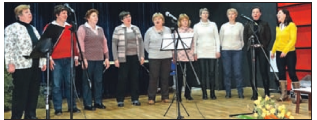
Za kulturne trenutke je na občnem zboru poskrbel lani ustanovljen zborček društva.

Tudi v letošnjem delovnem programu je veliko aktivnosti namenjenih pridobivanju novega znanja, prav tako druženju na strokovni ekskurziji, izletih, kulturnih prireditvah, sodelovanju na sejmih, v že omenjenih projektih LAS-a.