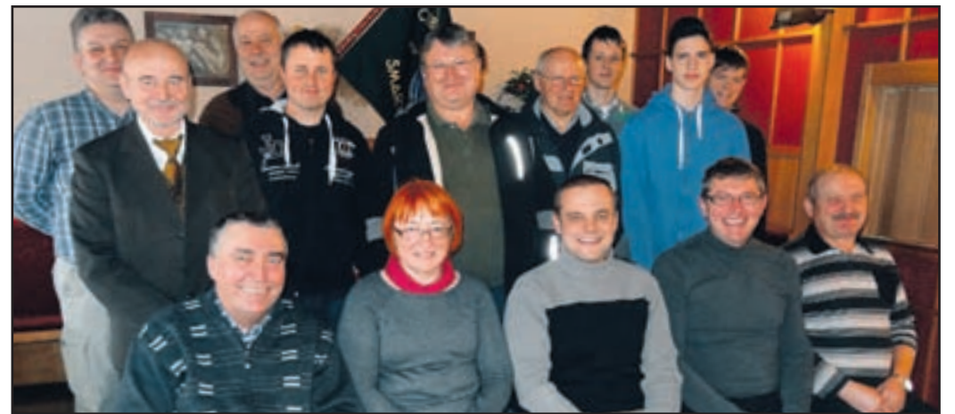
»Malo nas je, a delamo zavzeto kot velika društva,« pravijo šmarški čebelarji.

Poleg osnovne dejavnosti in skrbi za podmladek bosta prav izobraževanje članov in potrošnikov ter skrb za kakovost izdelkov letošnji osrednji nalogi društva. »Čebelarstvo zveza Slovenije skrbi za izobraževanje potrošnikov, v njene aktivnosti se po svojih močeh vključujemo tudi mi. Veseli smo, da so ti vse bolj osveščeni, da vse pogosteje posega-