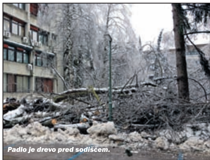
Padlo je drevo pred sodiščem.