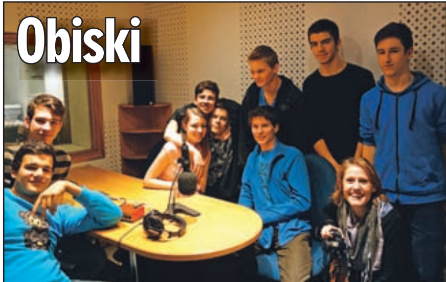
Dijaki Elektro in računalniške šole, ki pripravljajo film

Sicer pa smo v teh dneh nenehno med vami. Spremljamo, kaj se dogaja na terenu in vam skušamo z informacijami pomagati v teh težkih trenutkih. Skupaj z vami upamo, da bi mraz čim prej popustil.