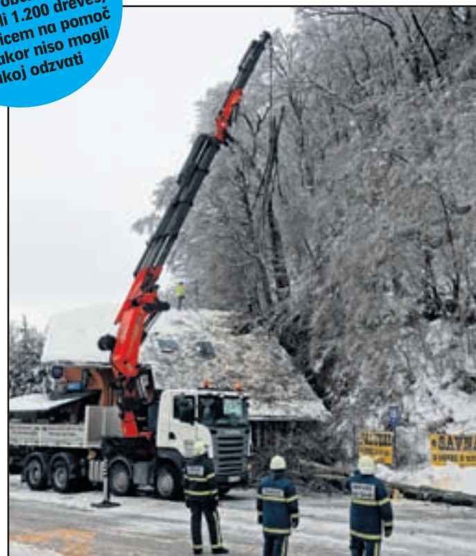
Na gostinski lokal Skalca je padlo več dreves, ki so jih spretno odstranili in preprečili še večjo škodo. Objekt so tudi intervencijsko prekrili.

Gasilci so imeli res polne roke dela, že v nedeljo so s cest odstranili 1.200 dreves, vsem klicem na pomoč se nikakor niso mogli takoj odzvati