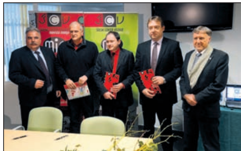
Z domačimi in tujimi poslovnimi partnerji so doslej podpisali 29 pogodb o sodelovanju. Pred tednom dni še s tremi.

take kadre. V Sloveniji se v preveč univerzitetnih programih izobražuje nezaposljiv kader. Za nas pa je pomembno tudi, da imamo z nadgradnjo MIC-a možnost za izobraževanje v politehniki. Smo na začet-