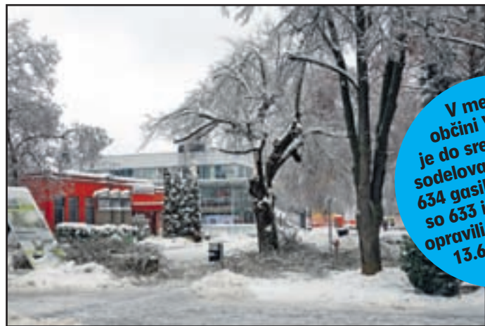
Nevarna so bila tudi drevesa v mestu.