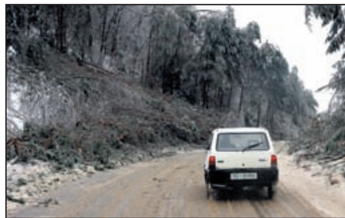
Poveljnik šoštanske civilne zaščite Peter Radoja je bil ves čas na terenu, »ujeli« smo ga na slabo prevoznih cestih v Gaberke.