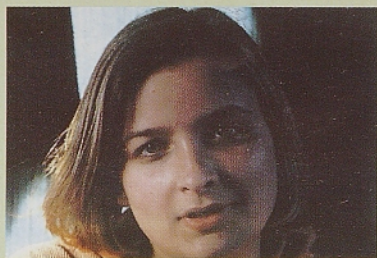
"Njene oči so govorile same."