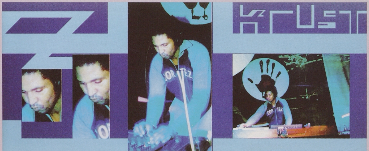
Krust v Clubu Maffia - Reggio Emilia