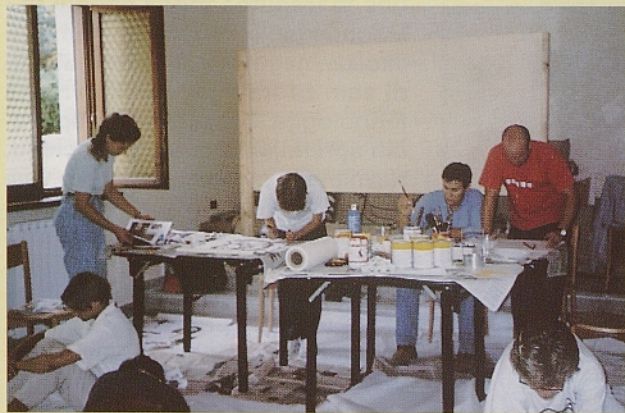
Likovna delavnica na 9. Dragi mladih.