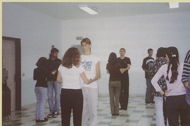
Mladi iz Trsta, Koroške in Slovenije so skupaj zaplesali.