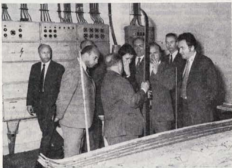
Ruska delegacija komiteja za šport in telesno kulturo v Elanu