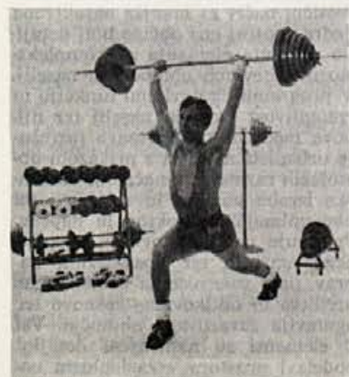
Elanov program za težkoatlete