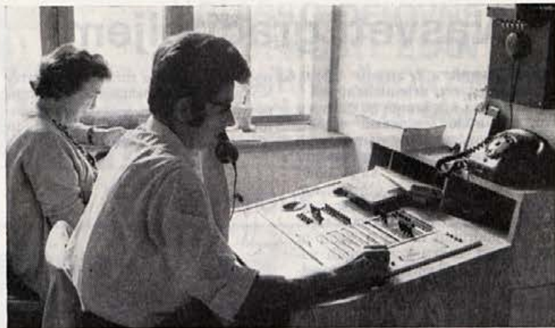
Vida in Tone pri vsakodnevem opravilu