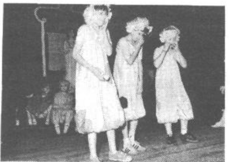
Prizor iz igrice Salon expon