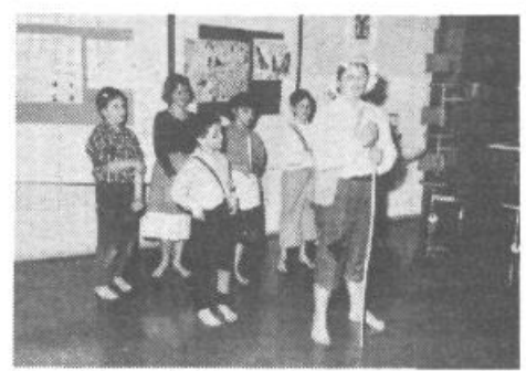
Z recitala pastirskih pesmi in običajev v OŠ Horjul

Podružnično osnovno šolo na Lavrici je letos obiskovalo 60 otrok. Žal je staro šolsko poslopje že krepko načel zob časa, zato bi najnuj potrebovalo popravila. Težave so zlasti ob večjih nalivih, ko voda vse čedeče vdira v poslopje in se nabira v kletnih prostorih. Rešitev je le v popolni sanaciji objekta, kar pa bi seveda terjalo precej sredstev. B. V.