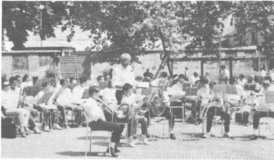
VIŠKI PIHALNI ORKESTER V I. SKUPINI