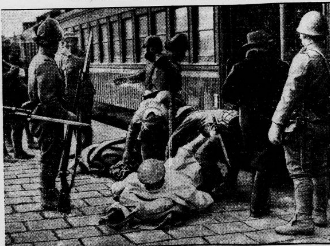
Nenadna japonska ofenziva na mandžursko-kitajski meji je prinesla napadalcu težke izgube. Japonci so sicer dosegli, kar so hoteli, ker so imeli številčno premoč in so bolje opremljeni za vojno, toda človeške žrtve, ki so jih pri tem utrpeli, so bile tako številne, da so morali odvažati ranjence z dolgiimi sanitetnimi vlaki v zaledje