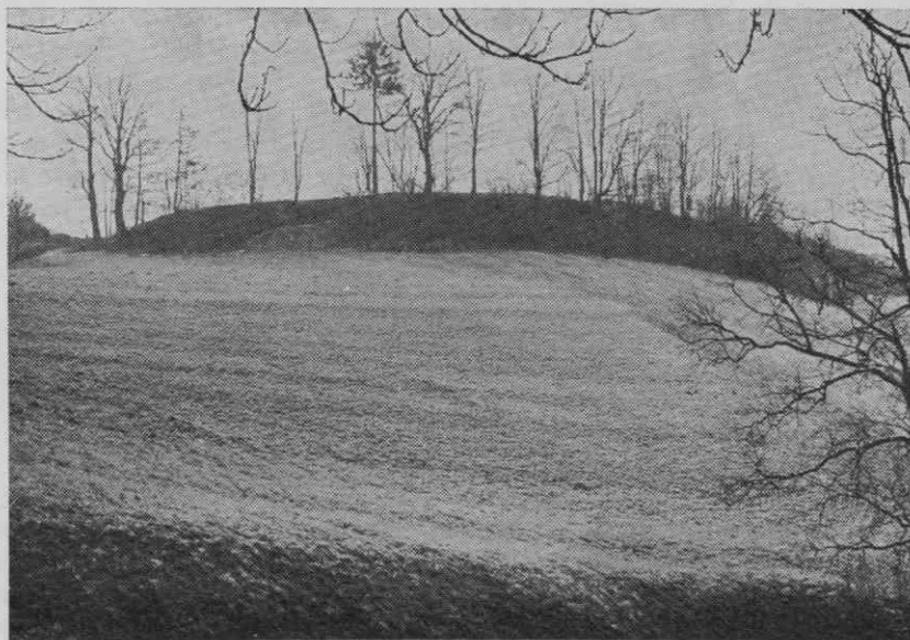
Novo mesto. Severni rob utrjenega prazgodovinskega gradišča na Marofu

Kronološki in tipološki razpon doslej odkritih grobov v Novem mestu nam dokazuje približno tisočstiristoletno naseljitveno kontinuiteto (okvirno od leta 1.000 pred n. št. do leta 400 n. št.), z dvema obdobjema velikega razcveta tega naselja: v srednjem in poznem halštatskem obdobju (650—300 pred n. št.)