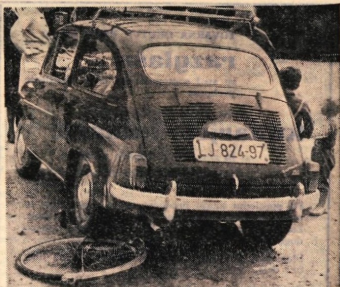
Prizor na naši fotografiji je bil posnet minuli ponedeljek dopoldne v Zireh, ko je neprevidna kolesarka zapeljala pred še bolj neprevidno voznico osebnega avtomobila. Na srečo so razen kolesa — tokrat vsi ostali nepoškodovani.

18. septembra franc. barv. CS film NEUKROTLJIVA ANGELIKA ob 16., 18. in 20. uri 19. septembra franc. barv. CS film NEUKROTLJIVA ANGELIKA ob 16. in 18. uri, nastopa ansambel AVSENIK ob 20.10. Kranj STORZIC 17. septembra amer. barv. VV film VESELA DEKLETA ob 16., 18. in 20. uri 18. septembra amer. barv. film SAMO NAPREJ, KAVBOJI ob 16., 18. in 20. uri 19. septembra amer. barv. CS film OPERACIJA GROM ob 16. in 20. uri, italij.-špan. barv. CS film POSLEDNJI BOJ ob 18. uri Tržič 17. septembra amer. film SREČANJE V PARKU ob 18. in 20. uri 19. septembra nastopa ansambel AVSENIK ob 17. uri, angl. barv. CS film NOČ GENERALOV ob 19.30.