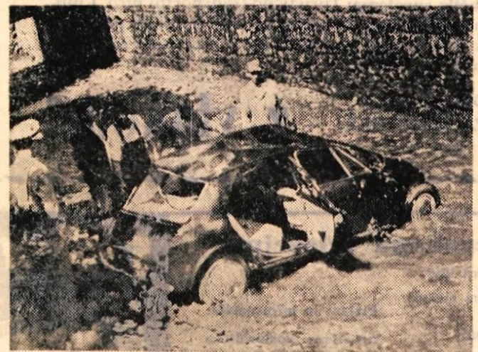
Pred kratkim se je v Poljanah pripetila nesreča, ko je avto zletel s ceste v potok Ločilnico. Na tem nevarnem ovinku je bilo že več nesreč.

točnika, roj. 1938, s Podvrha nad Poljanami. Domnevajo, da se je ponesrečil z mopedom in pri tem padel v reko.