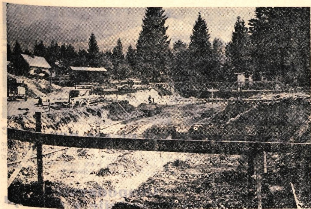
V Bohinju blizu hotela Jezero so začeli graditi poslovno-turistični center. Zgrajen bo do konca junija prihodnjega leta. Ze letos pa bo stavba pod streho.