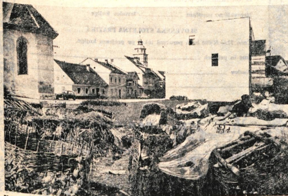
Kranjska razglednica

Gorenjska — Na Gorenjskem bodo v teh dneh dozoreli orehi. Pridelek bo izredno skromen zaradi mrzlih dni v času cvetenja in poznega snega. Podobno kot z orehi je s hruškami, jabolka pa so nadpovprečno dobro obrodila ne samo na Gorenjskem, temveč tudi na Štajerskem in Dolenjskem.