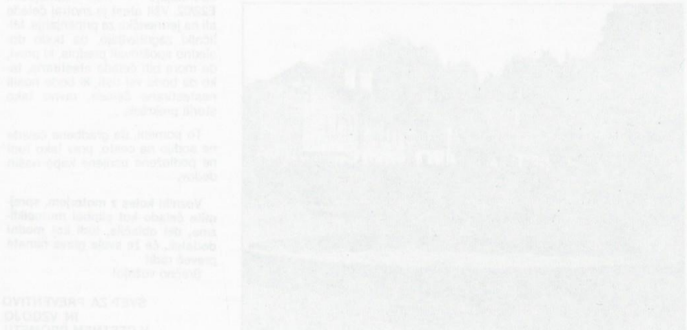
Deset let vrha v šahovstvu

Deset let vrha v šahovstvu opisuje Anja Rudič, ki je v letih 1988-1991 nastopila na svetovni šahovski lestvici. V knjigi opisuje, kako je v letih 1988-1991 nastopila na svetovni šahovski lestvici. V knjigi opisuje, kako je v letih 1988-1991 nastopila na svetovni šahovski lestvici.