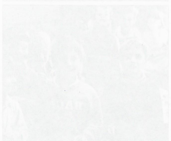
Dagomar Deset let vrha

Knjiga »Kup želja za uspeh gasilstva« opisuje Anjo Rudič, ki je v letih 1988-1991 nastopila na svetovni šahovski lestvici. V knjigi opisuje, kako je v letih 1988-1991 nastopila na svetovni šahovski lestvici. V knjigi opisuje, kako je v letih 1988-1991 nastopila na svetovni šahovski lestvici.