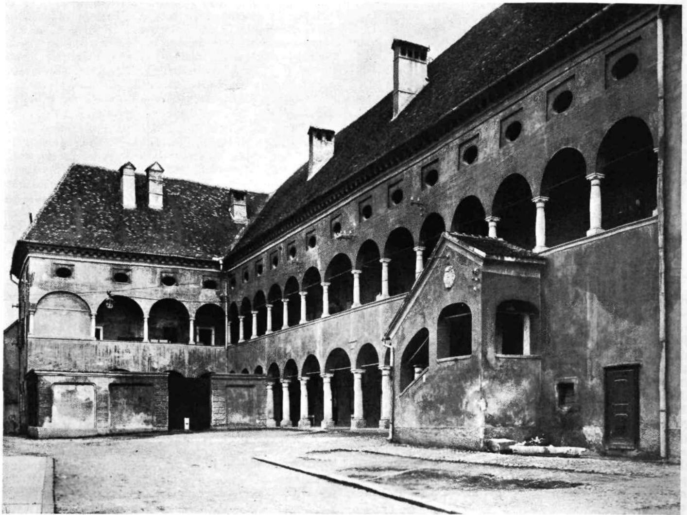
Celje: Stara groflja