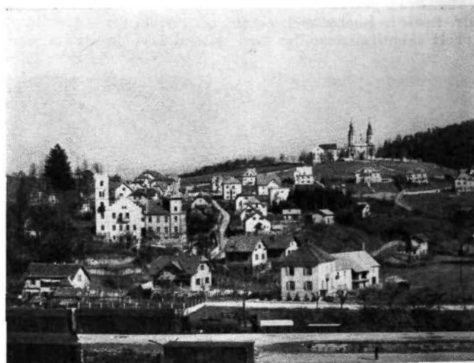
Celje: Hrib sv. Jožefa po zazidavi