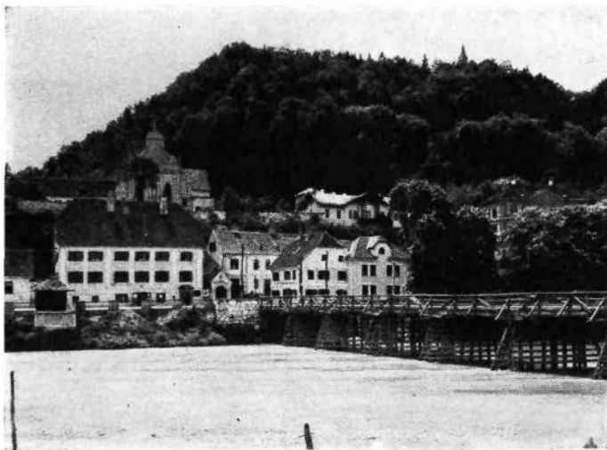
Celje: Stari most