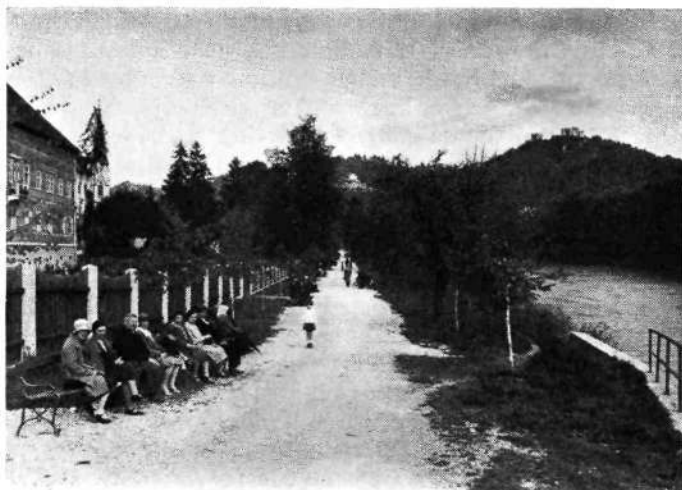
Celje: Masarykovo nabrežje sedaj

naj bi se v Celju ustanovilo privatno učiteljsiše, češ da je treba pravočasno poskrbeti za učiteljski naraščaj, ki ga bo po vojni obilo treba. Občinski svet je ta predlog radostno sprejel. Sličnega značaja je bil sklep, naj se obema meščanskima šolama, ki sta bili triletni, priključi še skupni zaključni letnik.