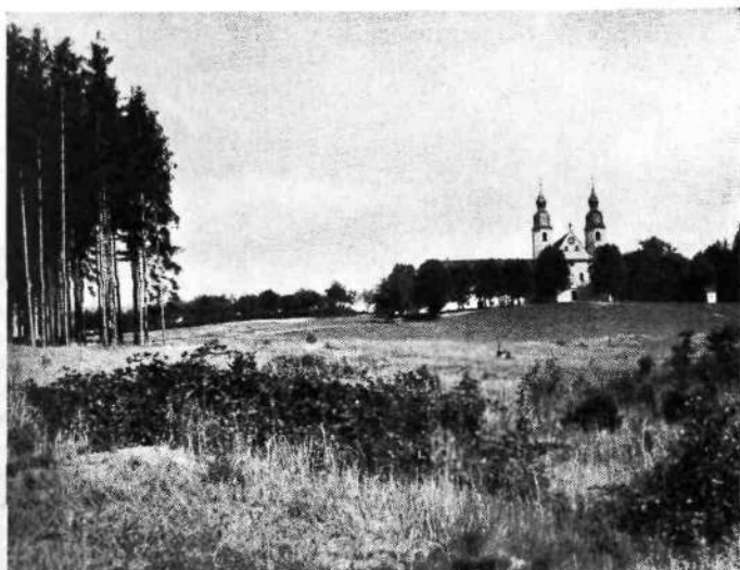
Celje: Hrib sv. Jožefa pred zazidavo

Prva slovenska občinska uprava je imela prirodno gerentski značaj. Na magistratu je morala menjati osebe in duh, kar se je sicer izvršilo prav prirodno in brez nasilja.