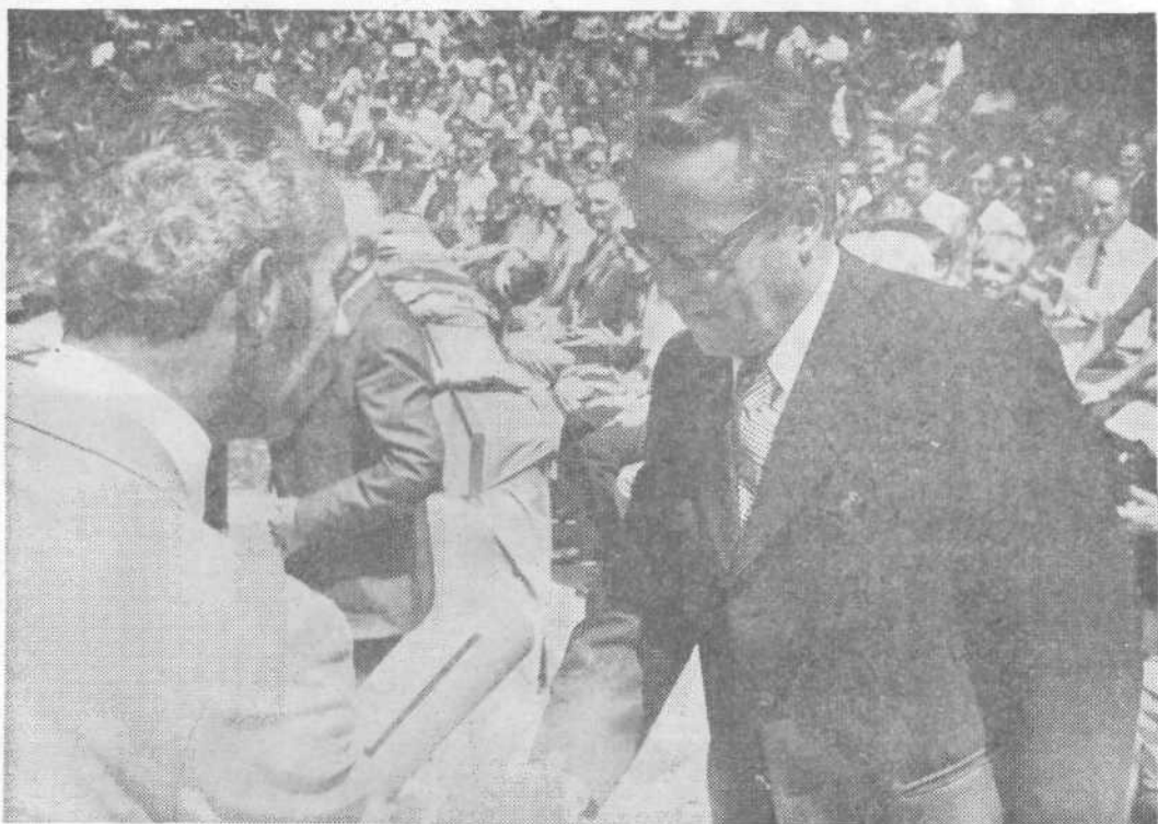
Predsednik skupščine občine Ljubljana-Siška je podelil na slavnostni proslavi na Rašici občinske nagrade