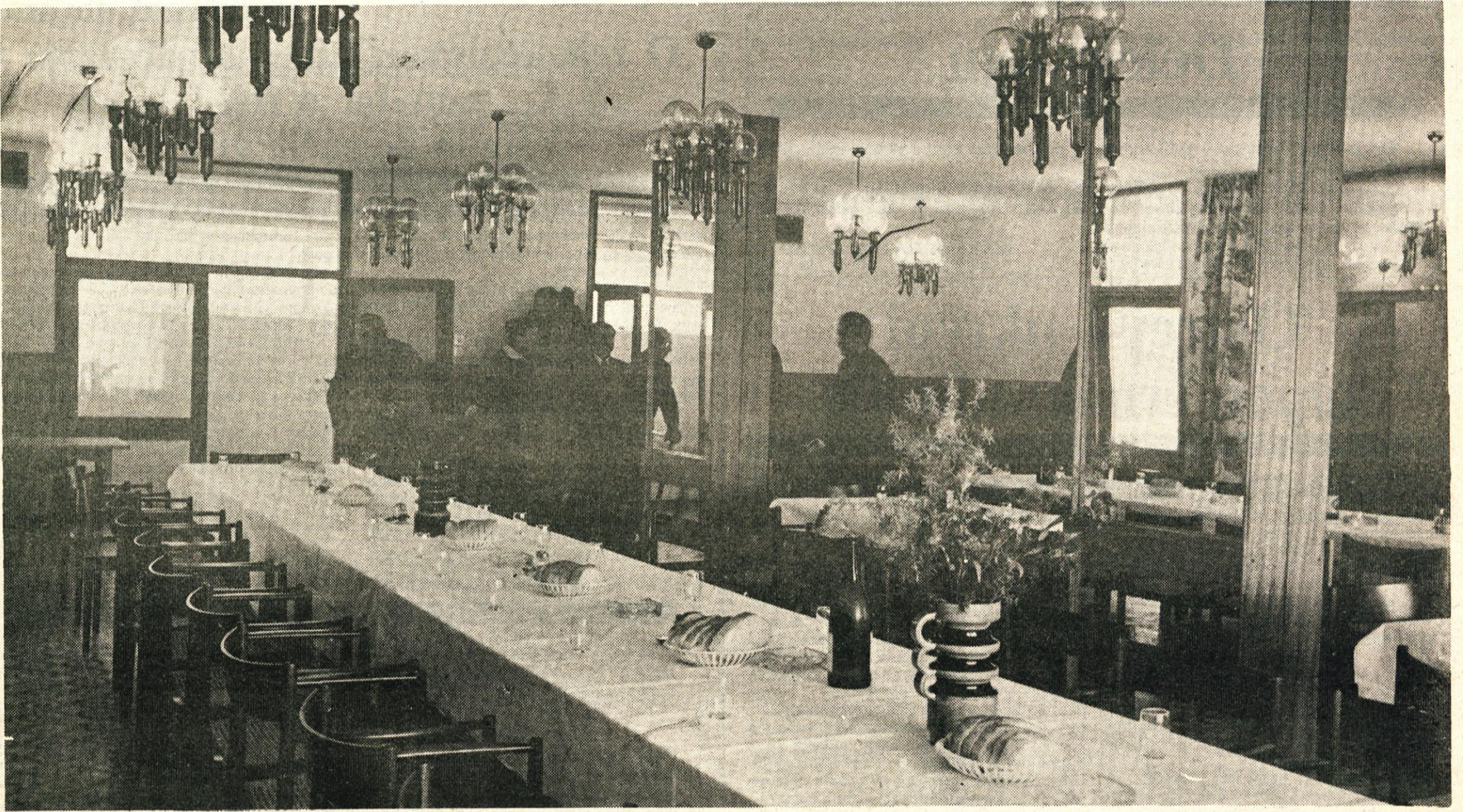
Dom „Tisje“ v Črnem potoku je lepo in moderno urejen, oskrbovanci pa se v njem počutijo zelo dobro

Dom „Tisje“ je bil ustanovljen 19/11–1946. leta. Takrat je, tako kot vsi ostali domovi na Slovenskem, sprejemal ljudi, za katere ni nihče skrbel. Z novo vsebino socialističnega humanizma pa družba vedno bolj skrbi za razvoj domskih oblik socialnega varstva.