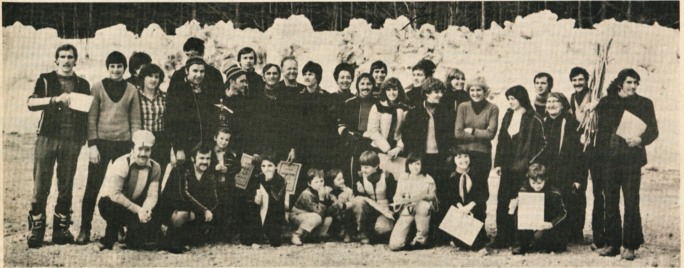
Bilo je prijetno in koristno, za zaključek pa še spominski posnetek