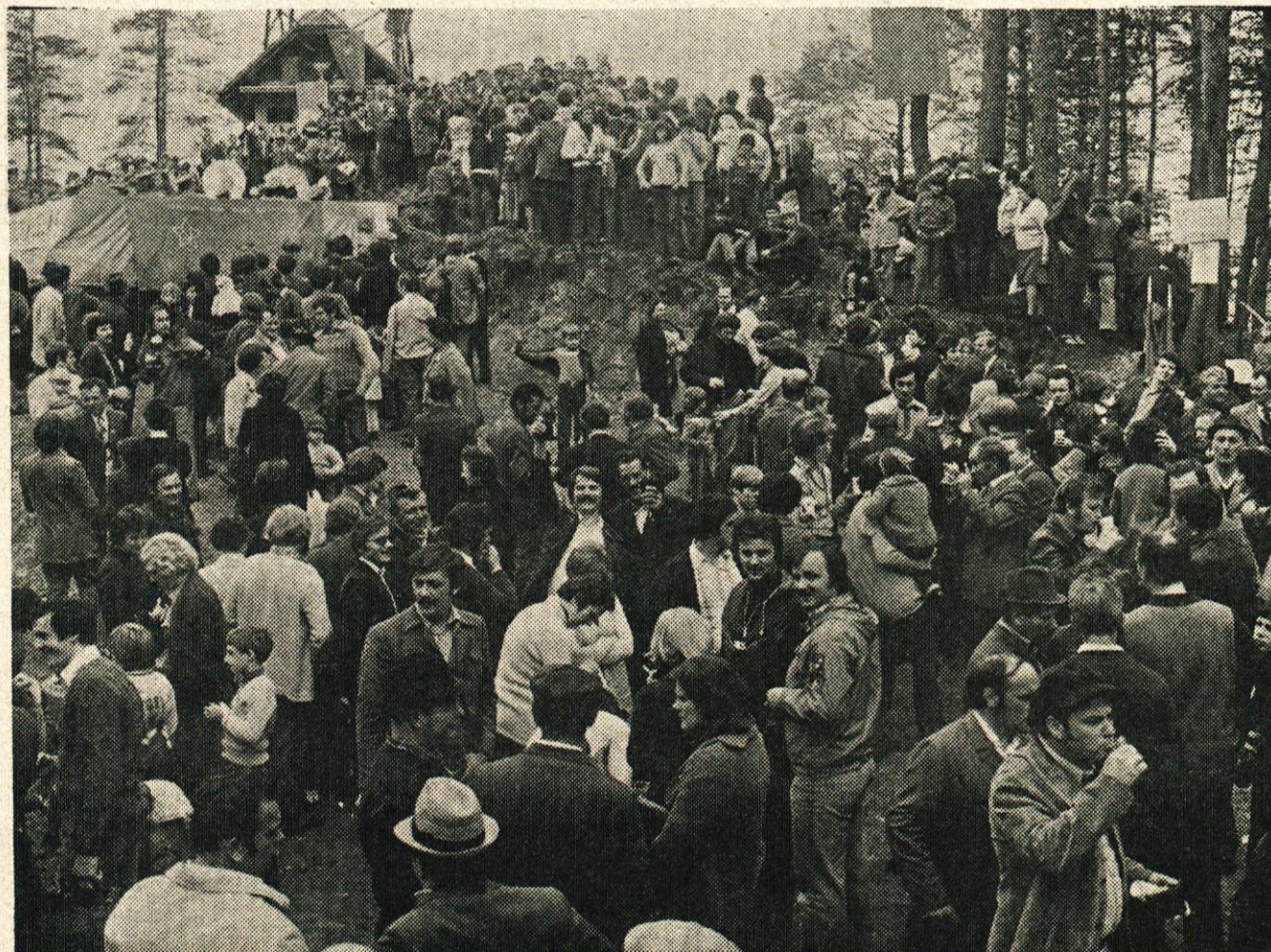
Veselo razpoloženje in veliko občanov ter delovnih ljudi sta bili glavni značilnosti osrednje prvomajske proslave na Sitarjevcu