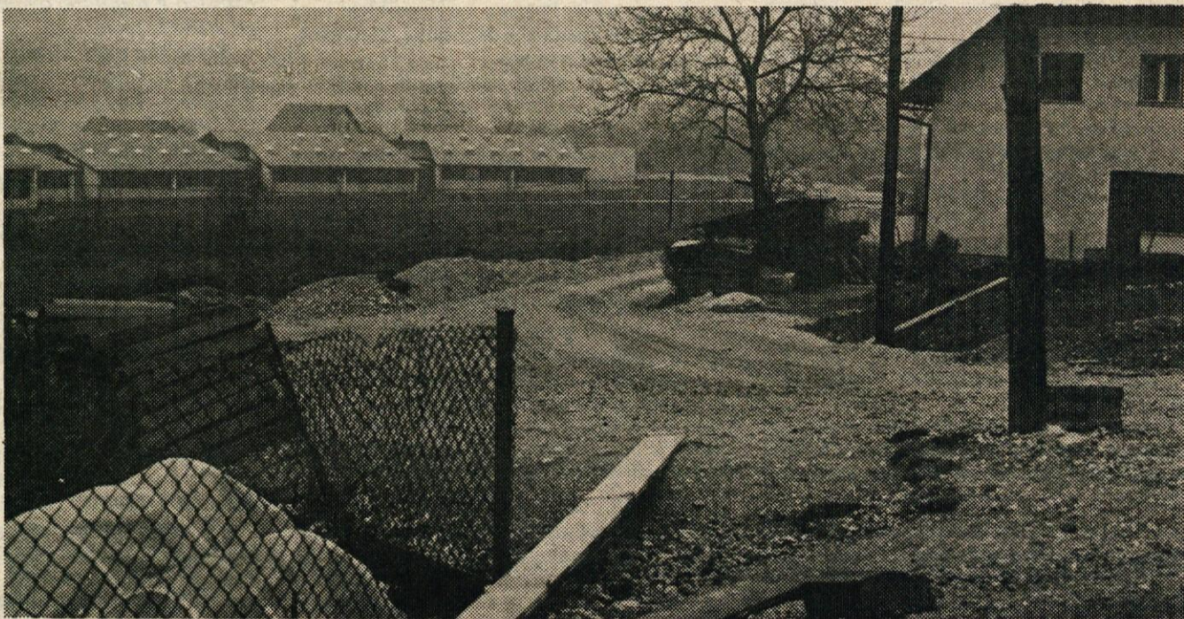
TOZD Gradmetal je izvajalec del pri gradnji nove ceste do osnovne šole na Graški Dobravi v Litiji. Z deli nekoliko zaostajajo zaradi nepredvidenih težav pri ureditvi zajetja naravnega izvira pitne vode, kar v projektu ni bilo predvideno. Delavci Gradmetala vzporedno z gradnjo ceste zamenjujejo tudi vodovodne cevi in urejajo kanalizacijo za bližnje hiše.

— Kmetijska zadruga Gabrovka — Dole gradi na Dolah pri Litiji novo trgovino. Dela so nekaj časa zastala, sedaj pa spet dobro napredujejo. Upajmo, da bodo dela dobro napredovala, vse dokler ne bo trgovina dokončana.