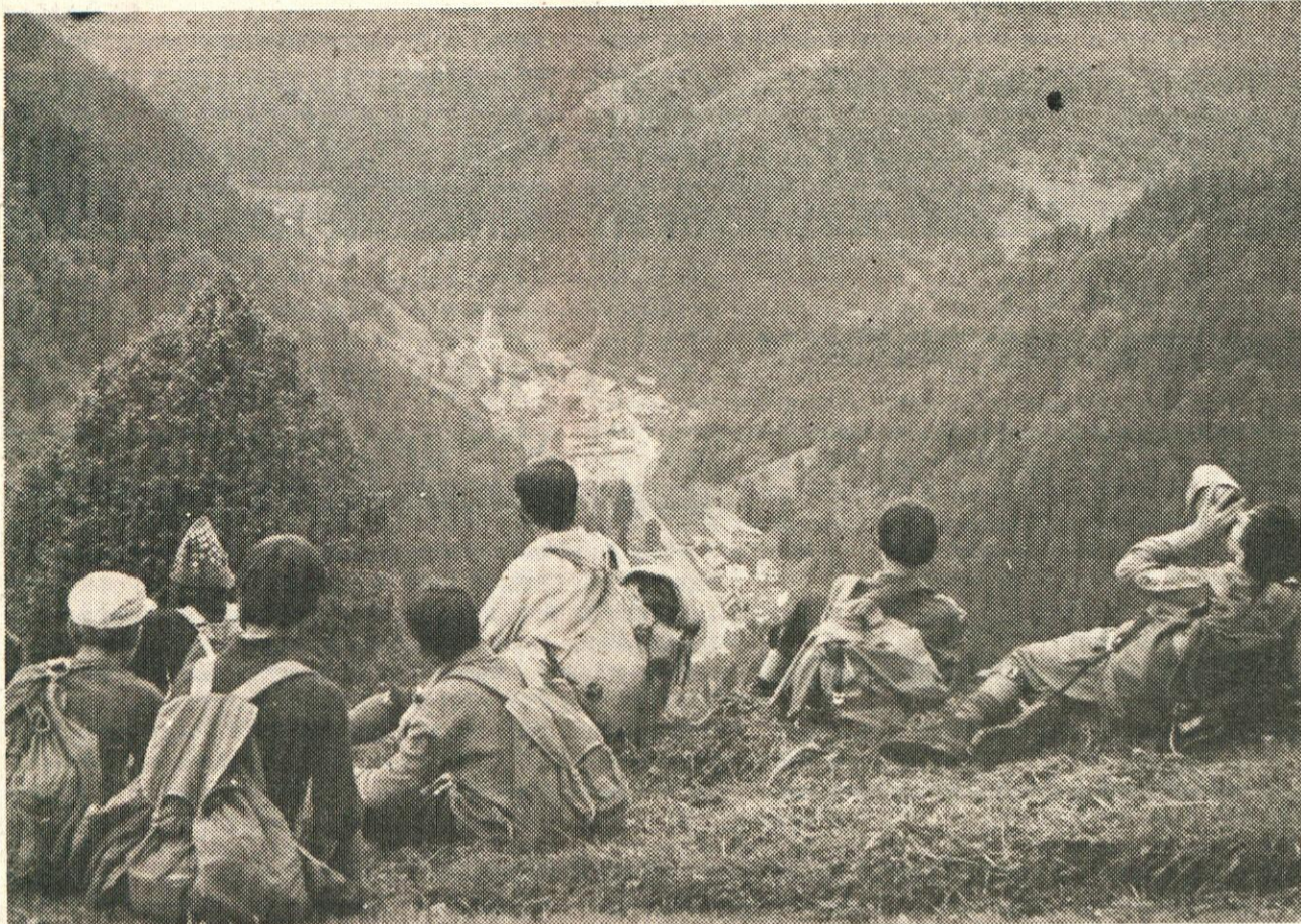
Pogled v dolino