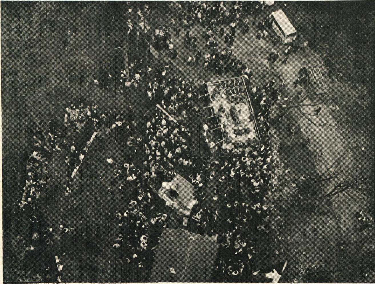
Takole je bilo videti množico občanov na Sitarjevcu z vrha pretvornika

Na večer pred 1. majem, mednarodnim delavskim praznikom, so s številnih hribov in gričev širom naše občine, zagoreli kresovi, s katerimi so delovni ljudje in občani začeli proslavljati svoj tradicionalni praznik. Ob prazničnem jutru je tudi sonce, ki je boječe posijalo izza oblakov, prispevalo k veselemu razpoloženju, ki ga tudi kasnejše poslabšanje vremena ni moglo pokvariti.