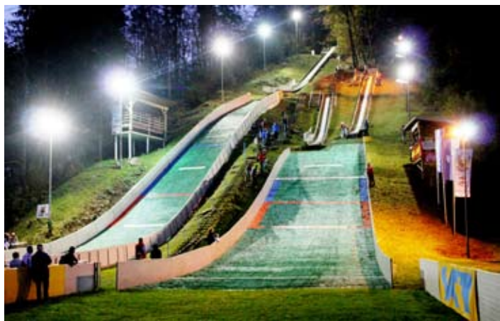
Vzdušje na nočni tekmi na Zalokah pod Gobavico.

Na tekmi za slovenski pokal so nastopili dečki in deklice od 9 do 13 let. Tako so skakali na vseh treh napravah, glede na svojo starostno