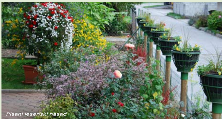
Pisani jesenski nasad