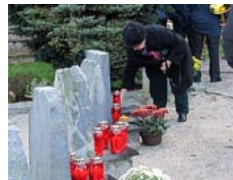
Spomin na padle borce