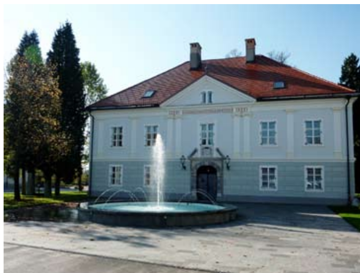
... in po njej.

Prenova gospodarskih objektov ob Ravbarjevem gradu je potekala sočasno s prenovo Ravbarjevega gradu. Najstarejši gospodarski objekt – kašča, ki stoji nasproti gradu ob glavnem vhodu, je bila prenovljena leta 2009. Prostor je bil v celoti