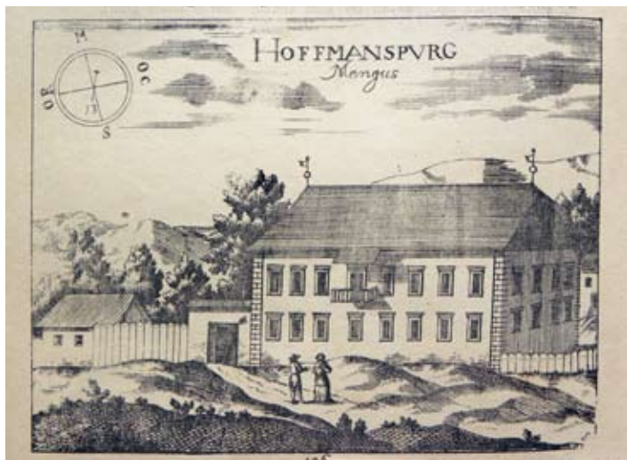
Ravbarjev grad leta 1679