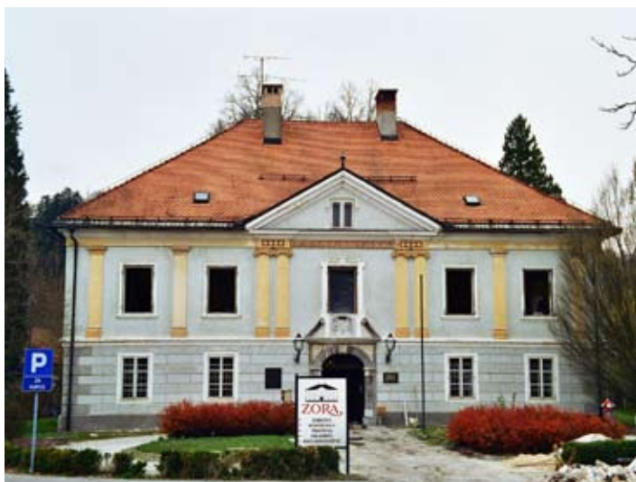
Ravbarjev grad pred obnovo ...

sekundarnim predelavam ohranil osnovno tlorisno razdelitev iz srede 19. stoletja. Grad je zidan iz kamna, zato je ostenje izredno široko. V času prenove gradu sredi osemdesetih let 20. stoletja so prostore pregradili z montažnimi stenami, ki so sicer posegale v obstoječe oboke, poškodovale pa jih niso. Grad je tako že leta 2006 doživel osvoboditev vseh sekundarnih predelnih sten in opažev. Trajno je bila odstranjena zasteklitev arkadnega hodnika v pritličju gradu, ki danes zopet prosto komunicira z drevoredom. V glavni veži so bili odstranjeni vsi sekundarni opaži in vetrolov. Vhodna veža je zopet dobila svoj reprezentančni status in pomen. V nadstropni etaži je obnova med leti 2006 in 2008 potekala po enakem načelu.