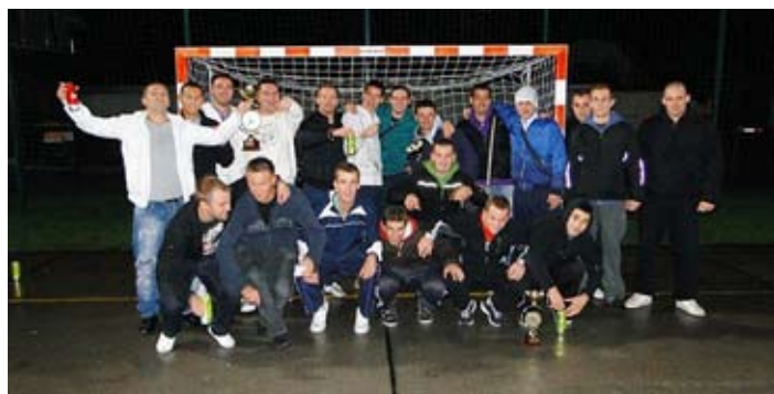
Udeleženci lige Loka 2010