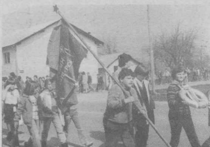
Tudi najmlajši so se pridružili deset — in desetisočem na pohodih Po poteh partizanske ljubljane. Na sliki so pionirji OŠ Karla Destovnika-Kajuha na pohodu proti Fužinam

Ce pogledamo analizo uresničevanja politike zaposlovanja v naši občini za prvih devet mesecev leta 1981, vidimo, da pogodbeno delo v primerjavi z letom 1980 upada. To pa še ne pomeni, da ga ni veliko, saj je bilo v lanskim omenjenih mesecih opravljenih 100.368 ur dela po pogodbah. Če pa primerjamo se obseg opravljenih nadur, vidimo, da se je leta povečal in jih je bilo v prvih devetih mesecih lanskega leta oprav-