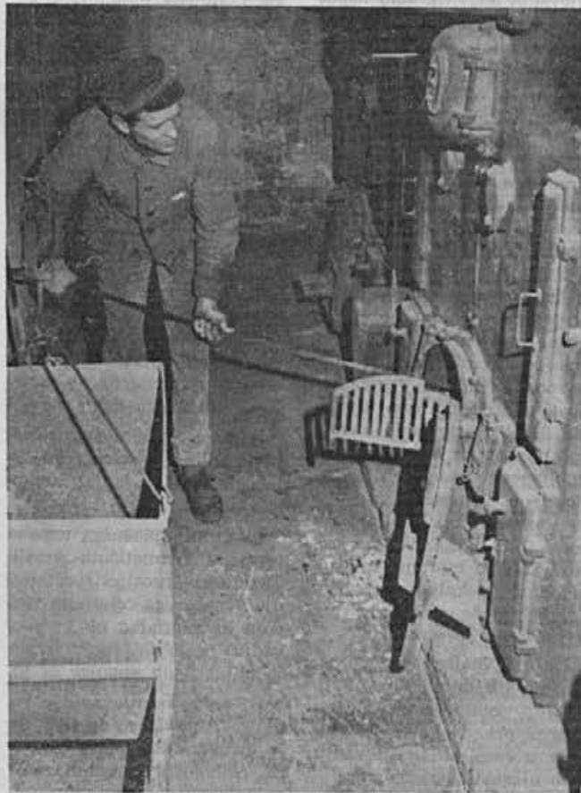
Kurjač v svojem delovnem okolju

Je zelo delaven tudi v družbenem življenju že od mladih nog: delal je v mladinski organizaciji, vodil združenje študentov na prirodoslovno matematični fakulteti, bil je predsednik sindikata prosvetnih delavcev, predsednik občinskega odbora sindikata družbenih dejavnosti v Skofji Loki, član republiškega odbora sindikata delavcev družbenih dejavnosti in član republiškega sveta zveze sindikata. Trenutno pa je podpredsed-