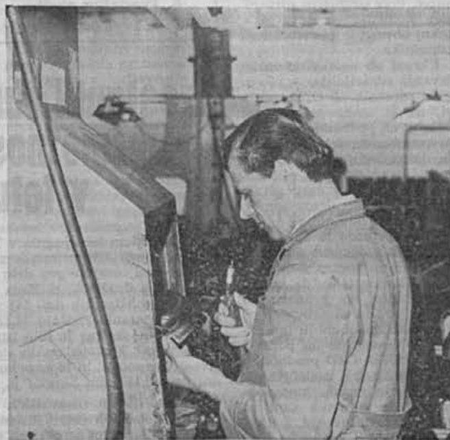
Finiš je pri izdelavi obutve zelo važen — pomaga pri prodaji

Za nanašanje apretur uporabljamo čevljarstvo pištolo s šobo, premera 0,5 mm in pritisk zraka 5–6 atm. Brizgamo z razdalje 30–40 cm in to