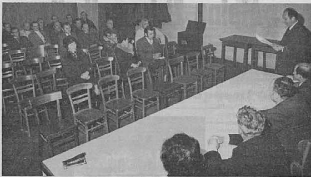
Občni zbor Muzejskega društva Ziri — v bodoče upajo na večje sodelovanje