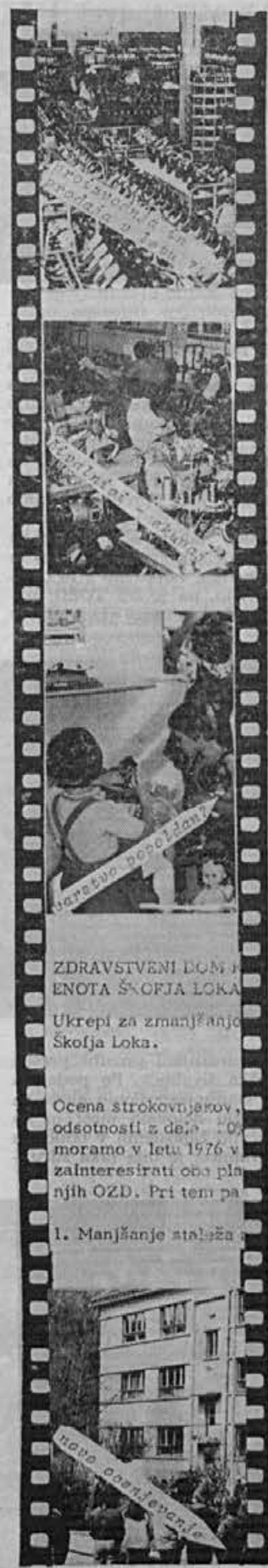
ZDRAVSTVENI DOM ENOTA ŠKOFJA LOKA