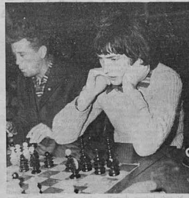
Napeto premišljevanje pred potezo