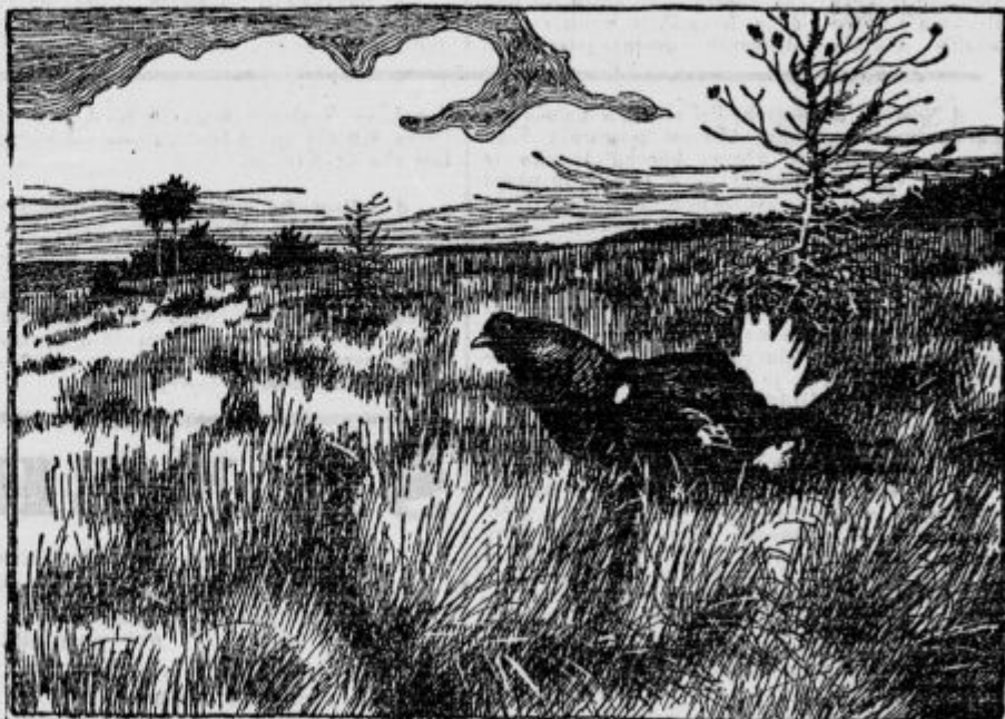
Ukrivljena peresa divjemu petelinu sorodnega ruševca si lovci radi zatikajo za klobuk.