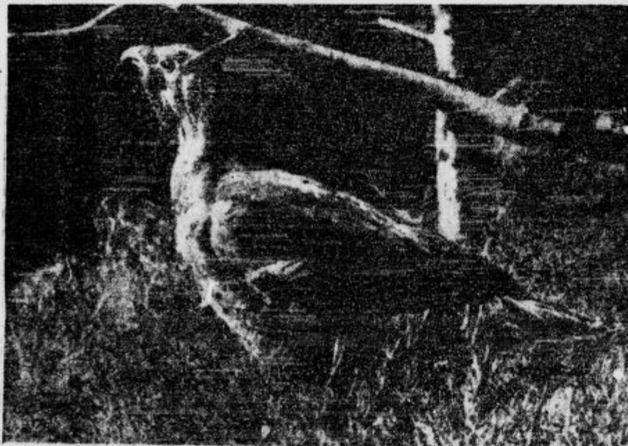
Kuhinja za moža in ženo. Hrana divje kure jepovsem drugačna od hrane njenega »moža«.

V Sibiriji love divje peteline na poseben način. Tunguzi spletejo velike košare s premikajočimi pokrovi. Na pokrov privežejo rdeče jagode. Ko ptica prileti na pokrov, se ta naglo preukne, ptica pade v košaro in ne more več iz nje, ker jo zopet zakriva pokrov. Tak lov pravim lovecem seveda ni po volji.