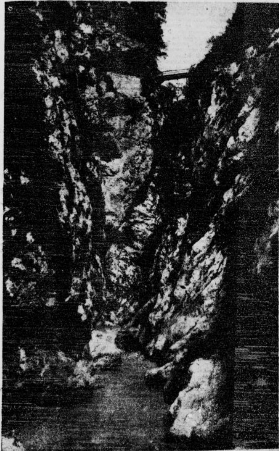
Soteska pod Dantejevo jamo na Tolminskem