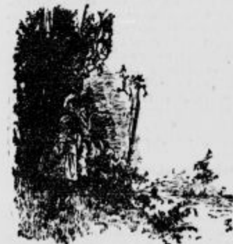
Zagledala sta kar dva ognja in mnogo ljudi okrog njih.

Ker tudi drugi Španec ni mogel več spati, sta skupno odšla iz trdnjave po znani stezi skozi gozd, ki je vodila na vrh gore. Mesece je osvetljeval vso okolico. Počasi sta se vzpenjala na vrh... Nenadoma pa je kapitan prvi