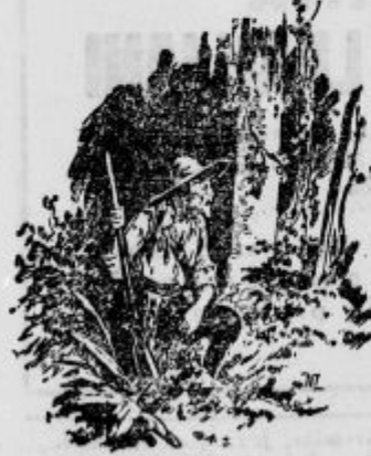
Kapitan je zagledal nenavadno svetlobo.

Toda španska narava je kakor narava vseh južnjakov, malo preudarna in preračunljiva. Njihova dejanja vodijo bolj nagoni in čustva, kot pa hladni razum. Oba Španca sta nemudoma stekla s hriba in zbudila tovariše. Kakor hitro so ti zvedeli za novico, so