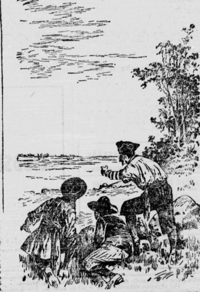
Trije Španci so zagledali kakih dvajset čolnov, ki so pluli proti otoku.

Povedal sem že, da so Španci zajeli tri divjake. Ti so postali sužnji in