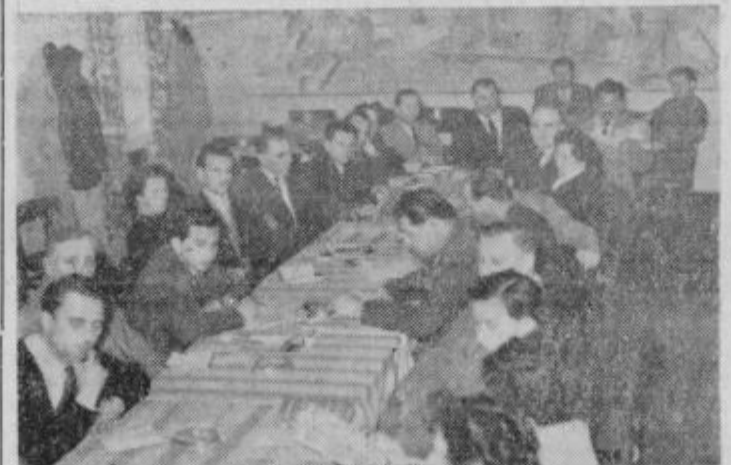
Ob zadnjem plenemu Obč. SS Ptuj

Da so Britanci v precepu, vidimo tudi na konferenci premierov Britanske skupnosti narodov. Osem članic je sprožilo problem nadaljnjega članstva Južnoafriške unije v skupnosti, ker izvaja politiko rasne nestrpnosti. Macmillan se zelo trudi, da bi unija ostala v skupnosti, ker je britanski kapital v tej deželi močno zastopan. Ne gre jim v račun, da bi skupnost propadla, ker bi bilo takšno dejstvo v sedanjem konkurenčnem boju med zahodnimi kapitalističnimi državami lahko za Britanijo zelo usodno.