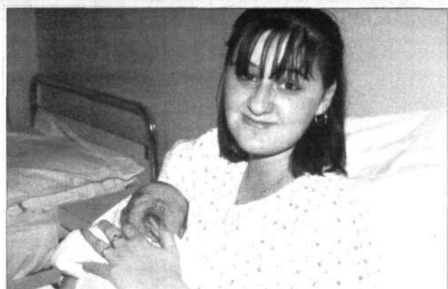
Mala Anja nad svojim prvim fotografiranjem ni bila ravno navdušena.

V Brežicah so prvo novorojenko v letošnjem letu dočakali šele v soboto, 4. januarja