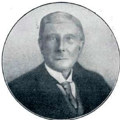
ALFRED ROCKEFELLER najbogatejši mož na svetu

Timrava je prišla v slovaško književnost kot dovršen talent; o njej se ne more reči: v tem spisu se začena njen razvoj in v onem se že kaže kot dovršena pisateljica. Vsi njeni spisi so dobri in predvsem izvorni. Timrava ima svoj način opisovanja, svojo dikcijo, ki