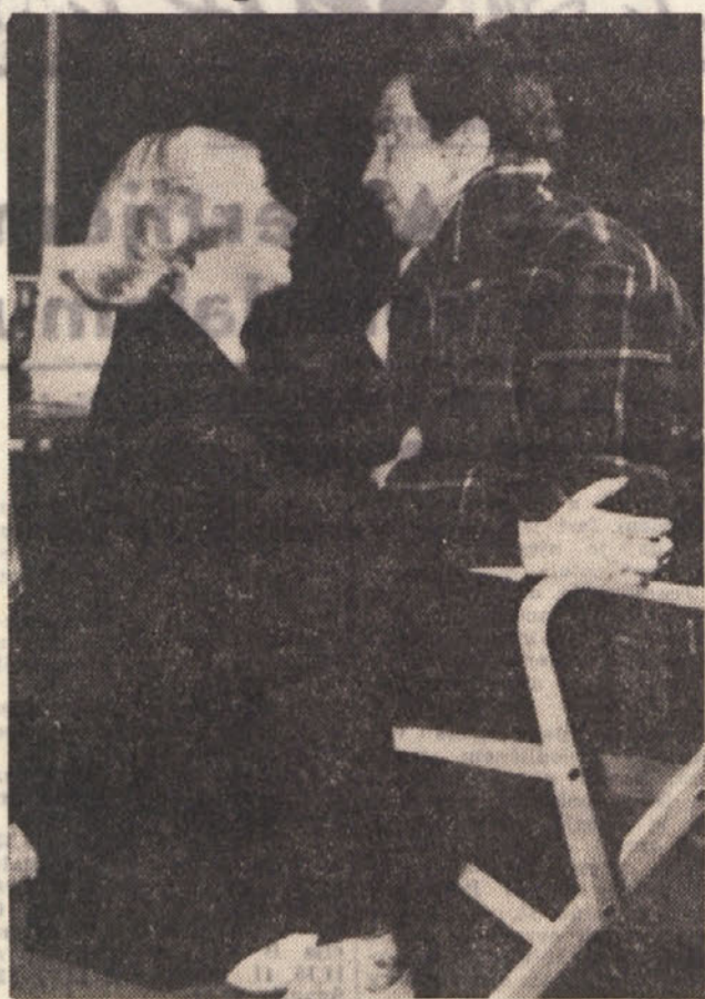
Nocoj nam bo Slovensko narodno gledališče uprizorilo novo letošnji premiero. To pot gre celo za krstno predstavo in sicer za Leopolda Lahole dramo »Madeži na Soncu«. Na sliki prizor iz »Madežev na Soncu«