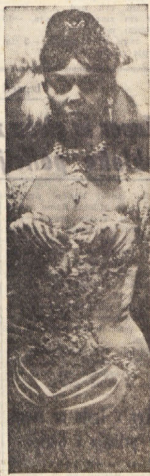
Na sliki deklica, ki pravi, da ima šestnajst let in da se klicata Gloria. Več ne vemo. Vemo le, da se je učila plesne umetnosti v Angliji in da nastopa sedaj v »Lidus« na Eilstopa sedaj v »Lidus« v Parizu, zlasti poljanah v Parizu. Spada med plesalke »bluebell« vendar pravi, da življenja še ne pozna. Kako bi tudi ga, ko ima 16 let

Pri drugem vprašanju (Kaj menijo o bodočnosti našega kmetijskega gospodarstva), pa sem trčil na enotno mnenje. Vsi zro zaključeno v bodočnost, češ: Stari smo in kmalu nas ne bo. Kaj bo s to božjo zemljo, ki jo tako zapuščajo kot uši mrtveca? Na koga naj na ta način računamo? Zdelo se mi je, da slišim glas obupanja in hkrati tožitelja.