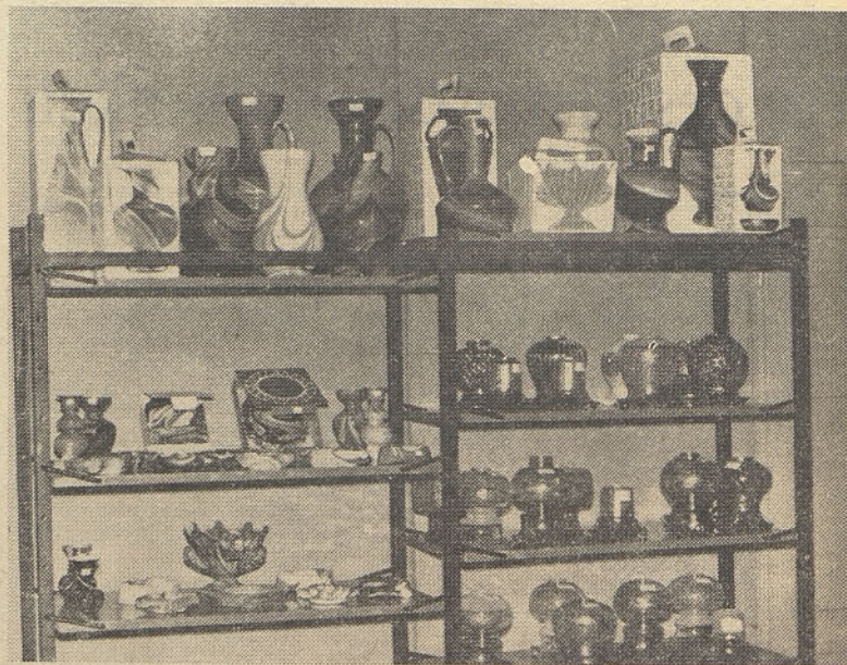
Izdelki iz ONIX stekla in razsvetljavna telesa v vzorčni sobi