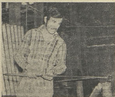
Krogljičar v TOZD I

Na nagradni kviz znanja iz prejšnje številke »STEKLARJA« smo prejeli 42 rešitev. Pravilni odgovori so: