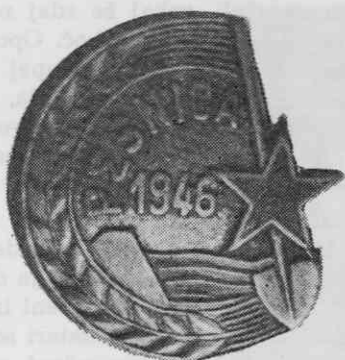
Znak »Pesnica 1946

Velik dogodek na Pesnici, do katerega pa sploh ni prišlo, bi bil pričakovani obisk predsednika Tita. Avgusta 1946 je bil predsednik Tito v Sloveniji in pričakovali so, da bo obiskal tudi pesniške brigadirje. V Ptujski brigadi so v pričakovanju Titovega prihoda na brigadni konferenci sklenili (verjetno ni bilo nič drugače v drugih brigadah), da bodo obdržali dnevno 200-odstotno preseganje norme. V Vestniku 19 je izšel članek pod naslovom »Mladina hoče Tita na Pesnico«. Brigadirji so se mrzlično pripravljali na njegov obisk, čistili so bivališča in postavljali slavo-loke. Grajsko streho in gasilski stolp so okrasili s Titovim imenom. Že obledele parole so zamenjali z novimi. Mlad Prekmurec je napisal pesem, ki jo je sklenil z besedami: »Tito, Tito, pridi k nam!« Pričakovanja se niso uresničila. S CK KPS so sporočili, naj pride komandant brigad z dvema udarnikoma takoj na Brdo po maršala. Po prihodu v Ljubljano so jih nemudoma posadili v avto in odpeljali na Brdo. Tam jih je pričakal adjutant, ki jim je povedal, da je maršal pred eno uro odpotoval v Beograd. Pojasnil je, da je prišlo do zapleta v mednarodni situaciji, ker so naši sestrelili ameriško letalo.