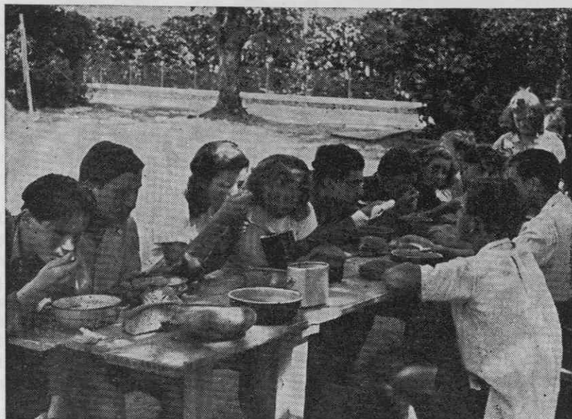
Brigadirji pri kosilu

sliti. Na Pesnici so imeli proste vse nedeljske popoldneve, ki so jih preležali v prijetni senci. Treba je dodati, da časopisni zapisi in tudi obujanja spominov nekdanjih brigadirjev ne pripovedujejo o predvojaški vzgoji na delovni akciji. Na progi Brčko—Banoviči je bila takrat predvojaška vzgoja že zelo temeljita, tudi s korakanjem in streljanjem. Vodili so jo pripadniki vojske. Najverjetneje tega na Pesnici res ni bilo.