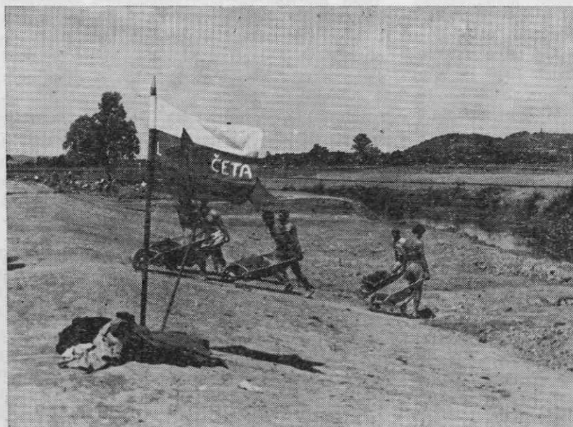
Delo na Pesnici

Ob koncu akcije je bil objavljen 10 pregled opravljenih del na Pesnici. Navedimo ga. Ob vsaki brigadi je v oklepaju dodan najprej čas, prebit na Pesnici, druga številka pa pove število delovnih dni. Navedene so: Prekmurska brigada (11. VII.—24. VIII., 3822 del. dni), II. Mariborska brigada (2. VII.—24. VIII., 5996), III. Ptujška brigada (11. VII.—20. VII. in 5. VIII.—24. VIII., 2920), IV. Celjska brigada (11. VII.—24. VIII., 5027), delovna skupina Brčko (11. VII.—20. VII., 52), VI. Mariborska brigada (11. VII.—24. VIII., 4756), VII. Celjska brigada (11. VII.—24. VIII., 4159), XI. Ljubljanska brigada (11. VII.—24. VIII., 6135), LŠM (1. VIII.—24. VIII., 734) in VIII. Ptujška brigada (5. VIII.—24. VIII., 418). Zmeda okrog poimenovanja teh brigad v časopisih je bila res temeljita, ker so bralci samo nekaj dni kasneje spet dobili 11 drugačno podobo o brigadah. Po tem poročilu bi se naj na končni proslavi v Mariboru zbrale naslednje pesniške brigade: I. Prekmurska brigada Štefana Kovača, Ljubljanska brigada, Mariborska brigada Bojana Iliča, Ptujška »leteča« brigada, Celjska brigada, Pesniška brigada in IV. Mariborska brigada Marice Kerenčič. Ta brigada ni bila na Pesnici, pač pa je bila ustanovljena za odstranjevanje ruševin v Mariboru (I. Mariborska mladinska delovna brigada je odšla