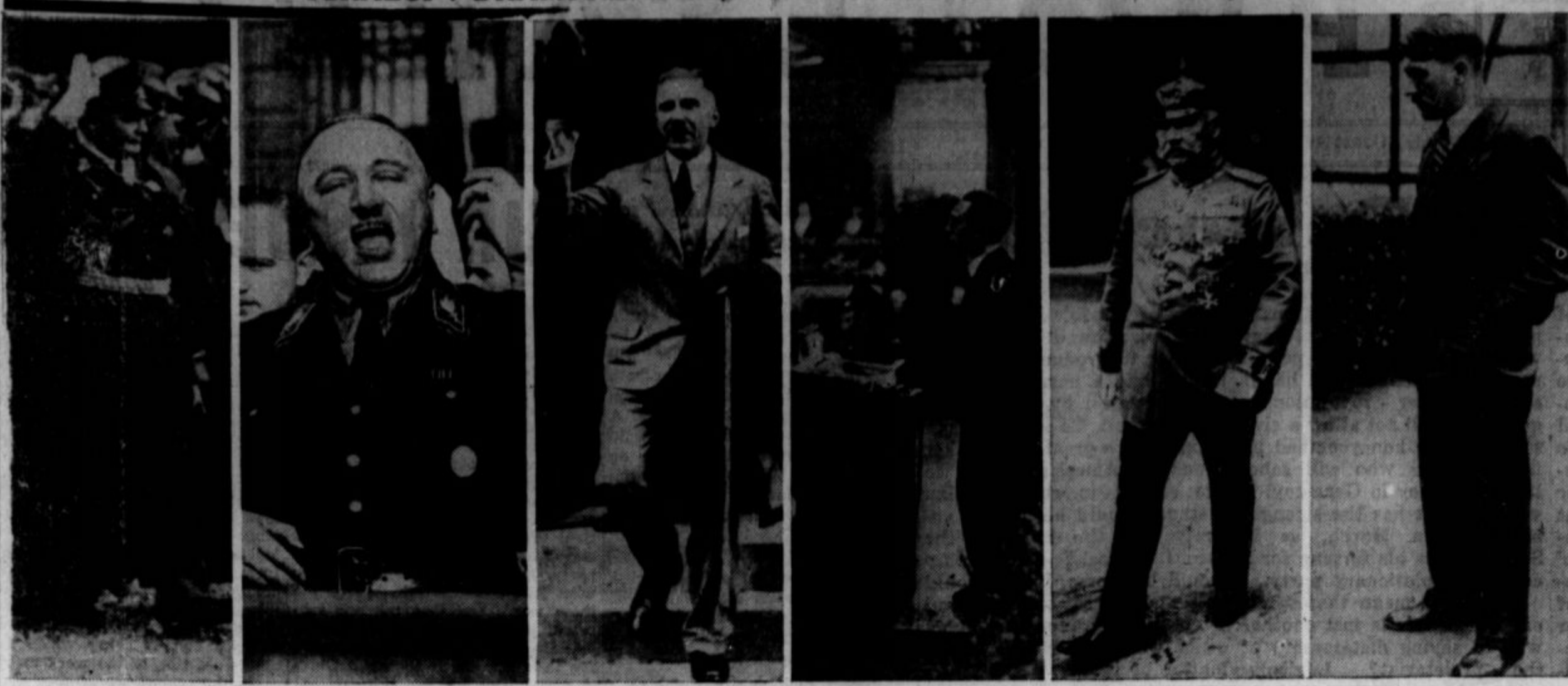
Na sliki od leve na desno je Herman Goering, premier Prusije in eden glavnih pomočnikov Hitlerja. Drugi je Emil Robert Ley, "car delavske fronte", reakcionar in velik podpornik kapitalističnih interesov. Tretji je podkancelar Franz von Papen, ki je bil med svetovno vojno nemški špijon v Zed. državah, potem dolgo let močnega klerikalni politik, končno kanceler Nemčije, ki je zgladil pot Hitlerju v vlado, in zdaj preganjan vsled svoje "nepokoričine" voditelju "tretjega cesarstva".