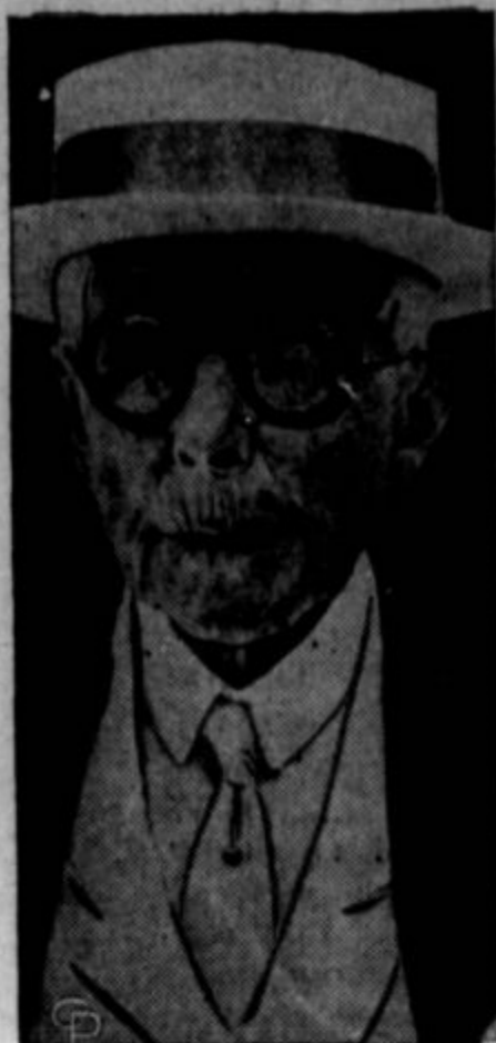
JOHN D. ROCKEFELLER

John D. Rockefeller st., ki mu je 95 let, se od prošle jeseni ne počuti več toliko dobro, da bi ga še veselilo igrati golf. Preje se je ukvarjal s tem sportom vsak dan. Zdaj